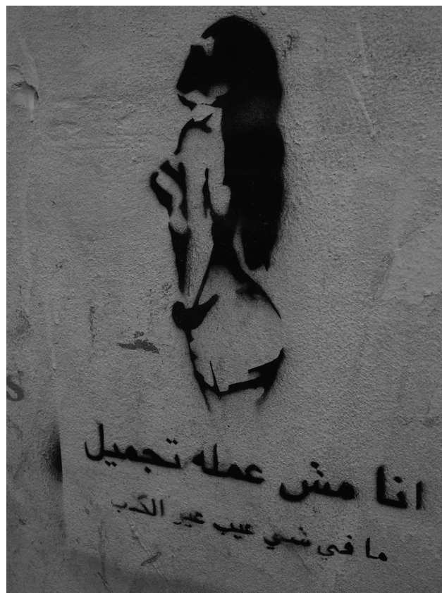
Illustration 1 – Pochoir sur un mur de Beyrouth (anonyme).

Mais, la chirurgie esthétique demeure dans une zone instable des sensibilités collectives. Au-delà des médecins peu scrupuleux ou des médias irresponsables, certaines critiques portent sur l'illusion de la modification corporelle comme en témoigne ce pochoir anonyme dans une rue de Beyrouth.