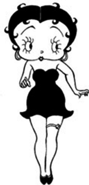
Illustration 6 – Betty Boop (dessin de Max Fleischer ©, 1931, Wikipédia).

Autrement dit, les êtres humains sont une version néoténique de certaines espèces de singe. « Le dessin de Betty Boop illustre certains traits humains qui sont parfois étiquetés comme néoténiques, comme une large tête, des bras et des jambes raccourcis par rapport à la taille, et des mouvements enfantins un peu gauches » [Bogin, (1988) 2001 : 15]. En somme, une femme mature ayant maintenu des éléments juvéniles comme la proportion de la tête par rapport au corps et, ce qui nous intéressera davantage, de grands yeux arrondis.