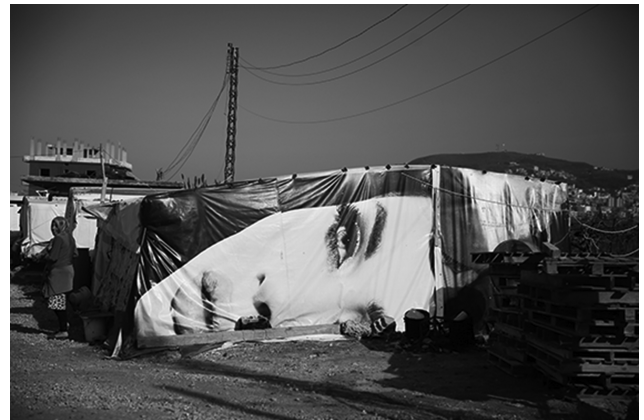
Illustration 3 – Affiche publicitaire utilisée comme toile de tente dans un camp de réfugié syrien au Liban.

En effet, en parallèle à ces discours publics sur le tajmil , il existe au Liban, comme partout dans le monde, une culture de la beauté qui se transmet de façon spécifique au pays, au sein des familles et dans les cercles d'amis. L'incorporation des normes débute dès l'enfance avec une accentuation lors de l'adolescence et de la post-adolescence. L'importance accordée à l'apparence de la personne, et notamment de la femme dans le cadre d'une construction de la féminité, se manifeste dans la forte présence sociale des thématiques du corps, de la mode et du style [Damerji, 2012] et dans l'engagement partagé en temps et en argent dans les techniques de beauté [Mallat, 2011]. Beaucoup considèrent la beauté comme un capital destiné à assurer une mobilité sociale, comme le note Edmonds à propos de la chirurgie esthétique au Brésil à laquelle les patientes de l'hôpital public de Santa Casa à Rio de Janeiro recourent comme un moyen d'obtenir « une mobilité sociale, un pouvoir érotique et un véritable rajeunissement physiologique » [2007 : 371. Voir aussi Laurent, 2010 : 463].