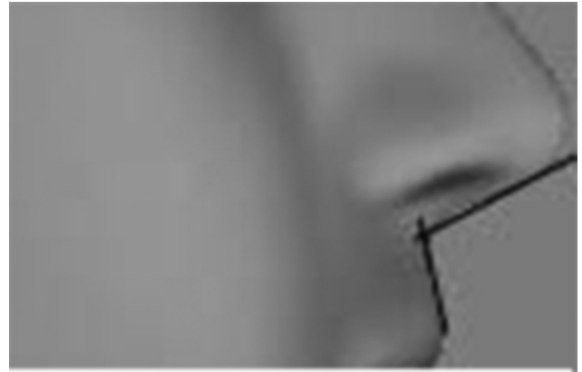
Illustration 5 – Angle naso-labial.

signale ne pas chercher à trop ouvrir l'angle naso-labial. De fait, le nez retroussé (où l'angle est très ouvert) est passé de mode, il correspondait selon Dr J. à une eupéanisation exagérée du nez.