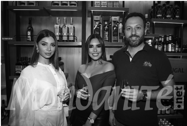
Illustration 4 – Soirée dégustation dans un magasin d'alcools fins de Beyrouth The Cask and Barrel . Revue Mondanité [capture d'écran : https://www.mondanite.net/category/events/social/ , 17/10/2019].