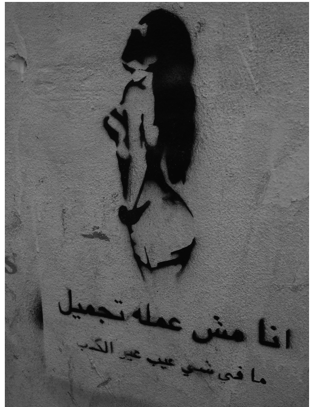
Illustration 1 – Pochoir sur un mur de Beyrouth (anonyme).

Mais, la chirurgie esthétique demeure dans une zone instable des sensibilités collectives. Au-delà des médecins peu scrupuleux ou des médias irresponsables, certaines critiques portent sur l'illusion de la modification corporelle comme en témoigne ce pochoir anonyme dans une rue de Beyrouth.