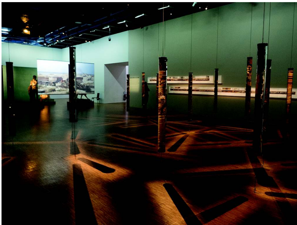
Fig. 5 : Joana Hadjithomas et Khalil Joreige, Discordances , 2017 (Prix Marcel Duchamp 2017, Centre Pompidou).

géologie, les discordances ( unconformities ). Les pierres gardent une mémoire de certains faits et racontent aussi les stratégies d'occupation humaine de la terre.