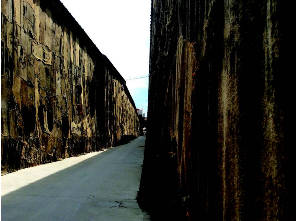
Fig. 2 : Ibrahim Mahama (1987), Out of Bounds , 2015 (Biennale internationale d'art contemporain de Venise, 2015). Les vieux sacs de jute cousus ensemble portent les noms des différentes denrées (comme le cacao) et de leurs revendeurs, agrégeant les récits de la circulation de la marchandise. Ici, l'artiste utilise essentiellement des sacs qui ont servi au transport du charbon au Ghana.

une souveraineté qui ne conduirait pas à une maîtrise impérieuse mais qui permettrait de vivre avec la catastrophe.