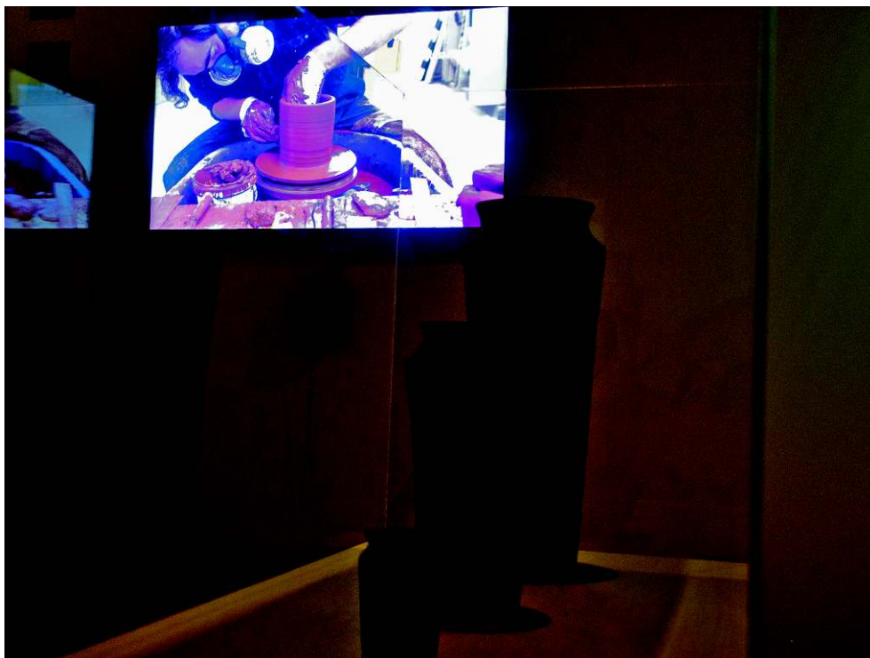
Fig. 4: Unknown Fields Division, Rare Earthenware , 2015 (exposition Reset Modernity! , ZKM, 2016).