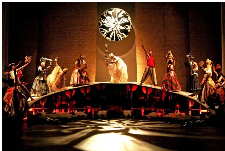
Image 1. Spectacle Quebranto du Grupo Sarandeiros, présenté en août 2009 au Teatro Sesiminas de Belo Horizonte. Ce spectacle a été conçu à partir de la méthodologie proposée dans ce travail. La traduction scénique réalisée par le Grupo Sarandeiros était basée sur des recherches de terrain dans des lieux de culte de candomblé à Belo Horizonte, dans l'étude bibliographique des mythes Yorubás au Brésil, et dans les ateliers de matrices de mouvements traditionnels des danses des Orixás. Photographie de Cindra Gomes.

Un processus de traduction basé sur une théorie interprétative désigne une perception spécifique, une pratique unique que l'on retrouve dans plusieurs actions basées sur l'expérience, traduites par un expéditeur et interprétées par un récepteur. Parmi ces actions, par exemple, la traduction d'une œuvre littéraire d'une langue à l'autre, la traduction simultanée d'un discours, le sous-titre d'un film, l'adaptation d'une œuvre littéraire pour la scène théâtrale ou la traduction scénique de manifestations traditionnelles dans les chorégraphies de danses brésiliennes, il existe des possibilités systémiques d'analyses diverses. En manipulant différents systèmes symboliques, le traducteur ouvre des possibilités de travail d'interprétation dans le domaine artistique à développer avec créativité, en rupture avec la notion de reproduction.