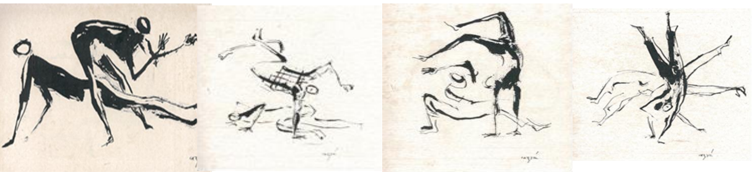
Images 1-4. Illustrations de Caribé (artiste plastique argentin naturalisé bahianais) pour le classique Capoeira Angola – Ensaio Sócio-Etnográfico (1968) de Waldeloir Rêgo.