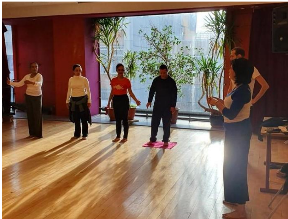
Image 1. Atelier Miudinho . Studio de Danse de l'Université Paris 8 Saint-Denis. Décembre 2019.

sont les genoux qui mesurent le degré de flexion, et c'est ce degré de flexion des genoux que nous appelons « accepter la gravité et le poids » dans le miudinho . Au cours de l'atelier, on a réalisé que marcher dans l'espace avec le tissu sous les pieds était un outil pédagogique qui aidait à comprendre le geste du miudinho . Il y avait également une évolution dans la compréhension perceptible du geste lorsqu'on a demandé de jouer avec le degré de flexion des genoux lors de la traversée de l'espace avec le tissu.