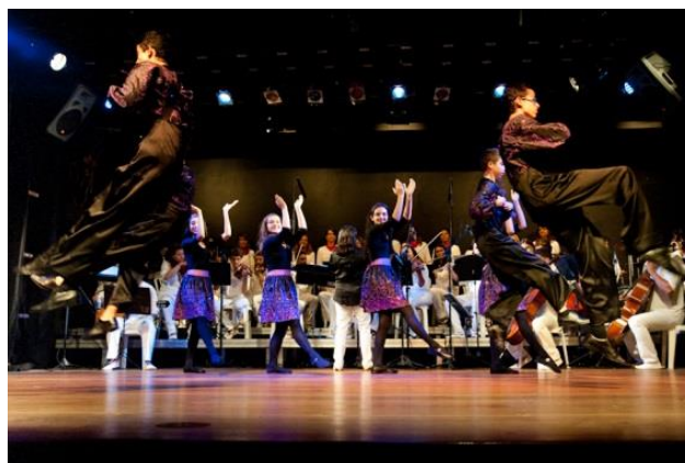
Images 2 et 3. Auto de Natal , présenté en décembre 2014 au théâtre Colégio Santo Agostinho de Belo Horizonte. Pour ce spectacle, la traduction des manifestations traditionnelles liées à la période de Noël au Brésil et dans le monde a été retravaillée à partir de compositions chorégraphiques adaptées aux capacités des groupes scolaires. Dans la scène, photo du pastoril , inspiré des fêtes de Noël au Minas Gerais, et d' Il Troto , inspiré des danses irlandaises.

Dans le processus de traduction de la tradition, les mouvements de danse des manifestations culturelles traditionnelles réorganisés par le regard unique de l'artiste et théorisés par les connaissances critiques d'un chercheur peuvent aider à déconstruire une image de fixité des traditions et de reproduction des traductions, à partir de multiples possibilités. Dans les travaux en groupe de danses brésiliennes, la manière dont les recherches sur le terrain sont menées et les choix opérés au cours d'un travail de traduction de la tradition déterminent une méthodologie d'action dans les œuvres de création, différente dans chaque groupe et dans chaque production. Tout processus méthodologique sera le résultat de multiples négociations entre les membres du projet et se traduira par un travail original. L'artiste-traducteur réalise ainsi une œuvre poétique à travers une interprétation personnelle et subjective et à partir de son expérience, car, en manipulant le texte source élaboré à partir d'une recherche de terrain, il crée une œuvre unique, originale et singulière. Ainsi, la