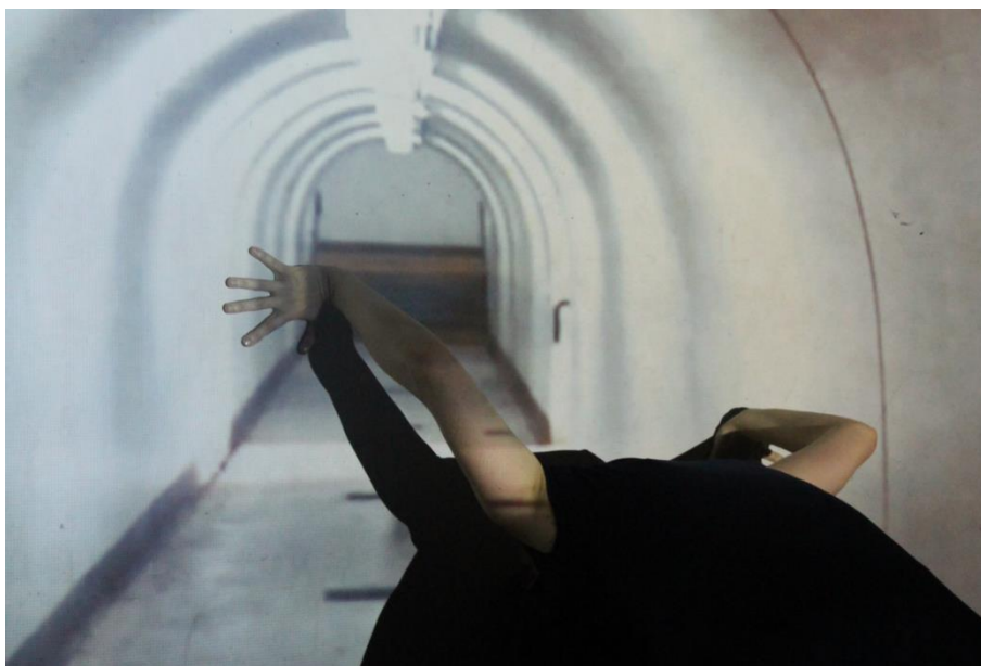
Image 2. Ocupación . Casa Sofía. Buenos Aires, 10/11/2018.

Ce texte m'accompagne depuis mon doctorat, sur la circulation de la capoeira entre le Brésil et la France. Comme d'autres références de ce processus de création, nous l'avons utilisée sur scène en tant que matérialité. Je le répétais plusieurs fois dans un mélange des trois langues qui étaient présentes pour moi à ce moment : le français (langue d'origine du texte), le portugais (ma langue d'origine) et l'espagnol (la langue du pays où j'habitais alors). Le texte était prononcé au moment final du spectacle, par un corps étrange, qui se déformait, qui évoquait un corps monstrueux et énonçait plusieurs combinaisons possibles, bien que peu probables, entre ses parties. Un corps capable d'articuler différentes couches temporelles et spatiales dans l'expérience commune.