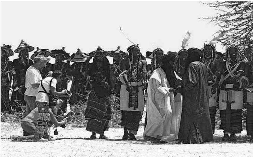
Cliché de l'auteur (2006).

DANSES woDAABe ORGANISÉES POUR LA RÉCEPTION DES OFFICIELS NIGÉRIENS. ASSEMBLÉE GÉNÉRALE DES PEULS woDAABe DU NIGER À AZANGHAGA, RÉGION DE TCHINTABARADEN.