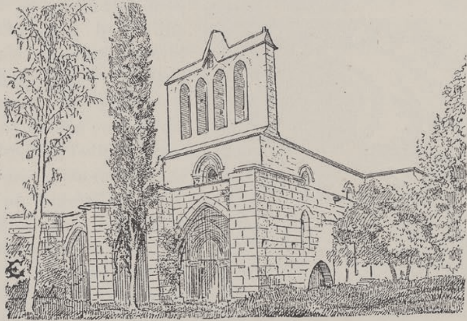
Fig. 119. — Parvis.