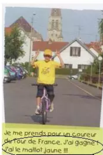
Figure 1: Vitamine 1 , p.46

Parmi les énoncés distribués, nous en avons choisi cinq à présenter ici, à titre d'exemple, dont les réponses sont significatives dans la mesure où elles se limitent, pour la grande majorité, uniquement au sens linguistique.