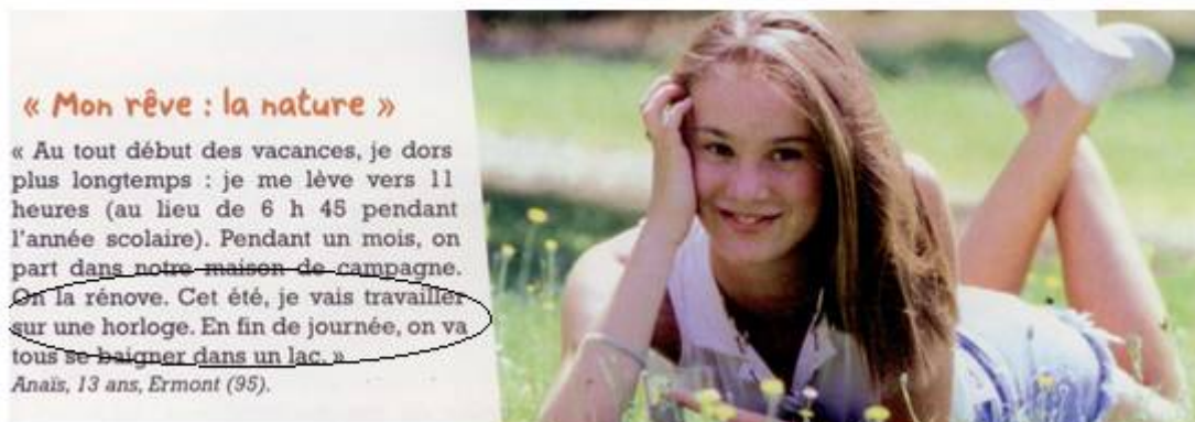
Figure 4 : Extra 1 , p.85