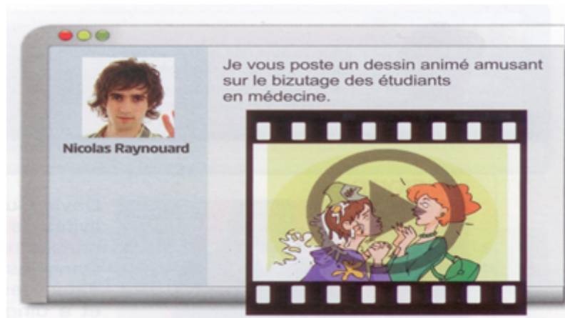
Figure 5 : Écho junior A2 , p. 13