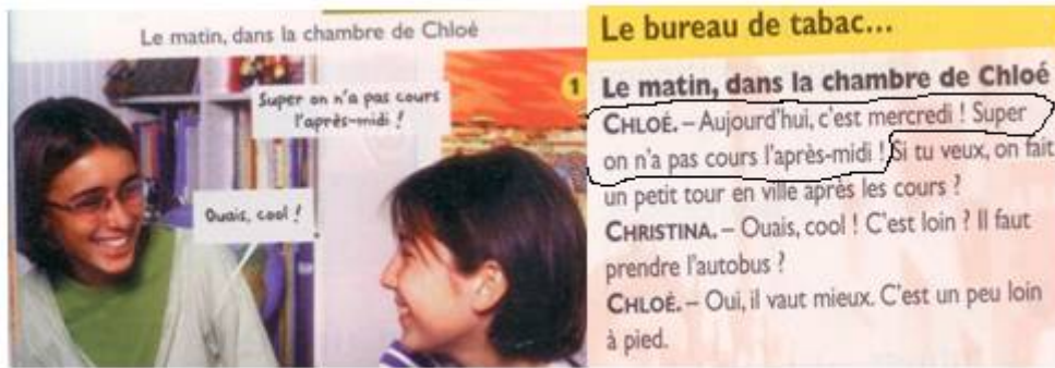
Figure 2 : Extra 1 , p. 48