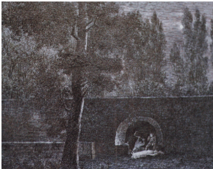
Ill. 6 : Anonyme (Illustration de la « Notice » d'A. Artaud), Les funérailles de Narcissa au jardin des plantes de Montpellier. Lithographie (?), 17 × 20,5 cm. Collection G.-B.