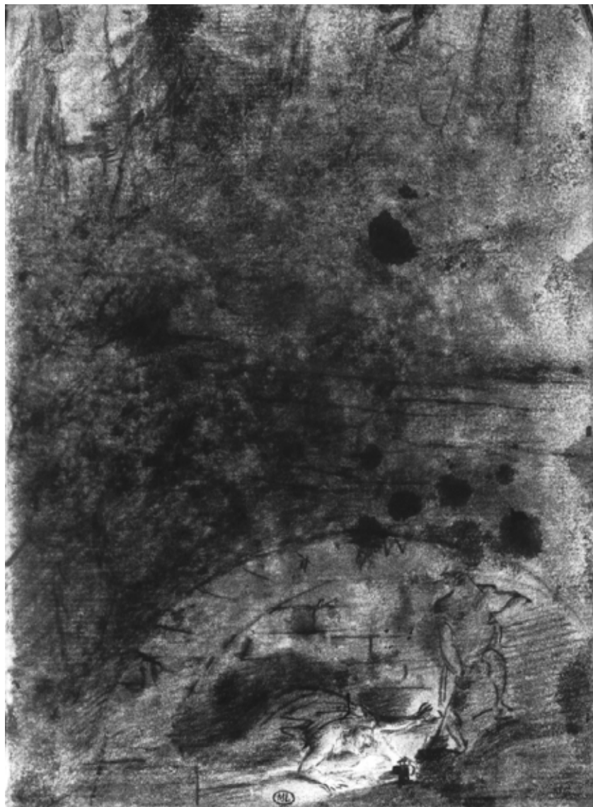
Ill. 5 : Gros, Young enterrant sa fille . Louvre Département des Arts Graphiques N° d'inventaire : RF 29556152