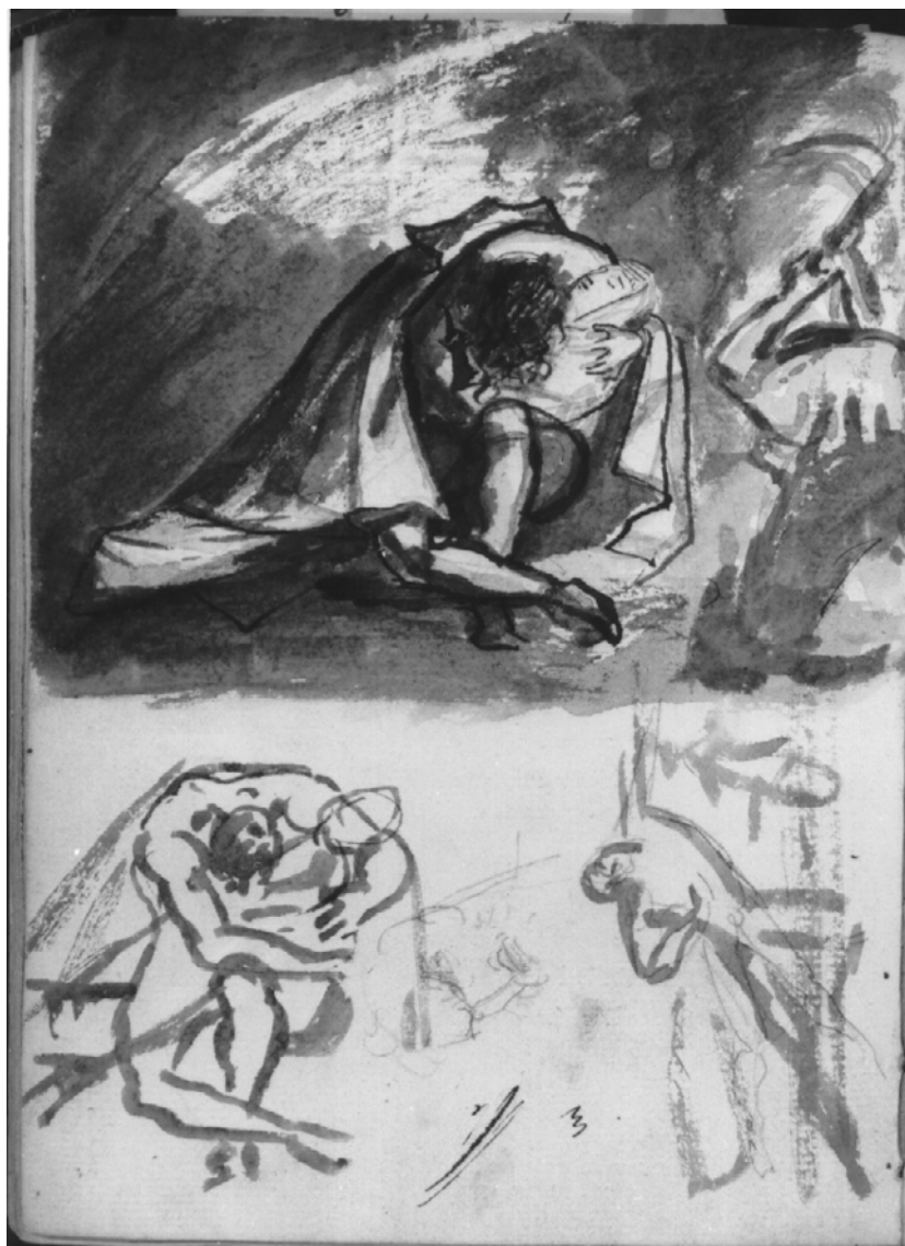
III. 4 : Gros, Désespoir d'Young . Louvres Département des Arts Graphiques N° d'inventaire : RF 29956/54 V