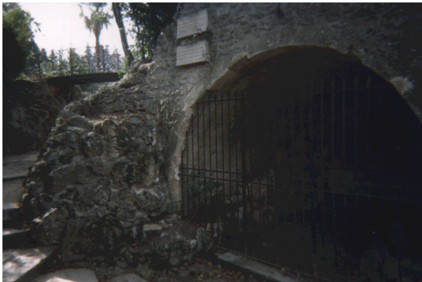
III. 8 et 9 La « tombe de Narcissa » de nos jours.