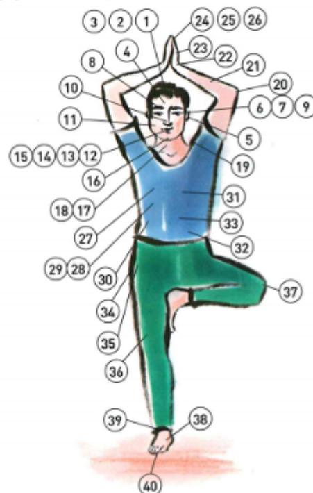
Image 6 (p. 34)