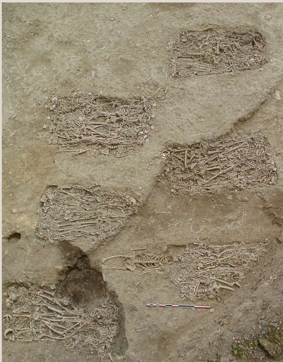
1. Vue d'ensemble d'un groupe de sépultures multiples.