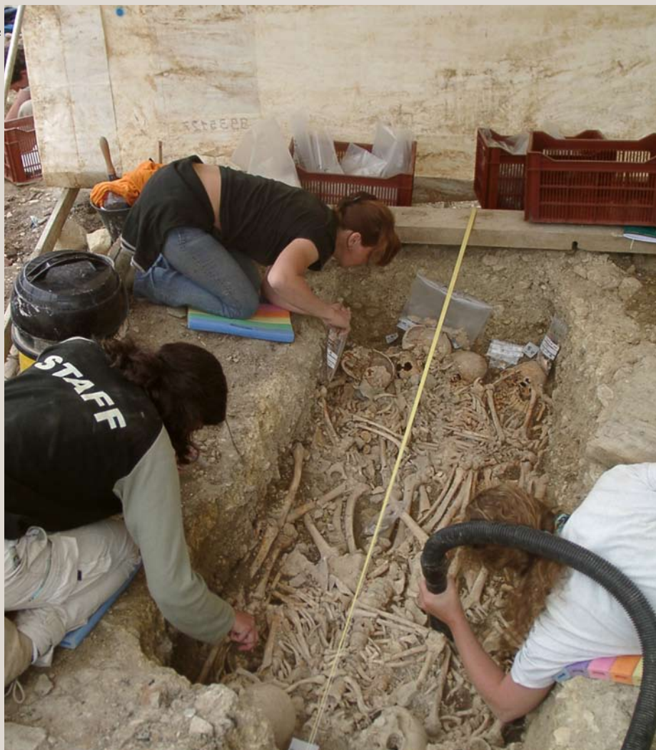
2. Nouveau nettoyage après prélèvements des individus du premier niveau.

La préparation au dessin consiste uniquement à installer un axe longitudinal, grâce à deux clous et à un point particulier servant de niveau de référence pour une prise d'altitude. Les clous et les points ont été relevés par le topographe pour être replacés sur le plan général. Le relevé graphique de la structure, sur papier millimétré (format A3), a eu pour objet principal de présenter les limites, les altitudes de fond ainsi que le niveau d'apparition de la fosse. L'échelle retenue pour la représentation graphique est le 1/10 e . L'étape suivante a consisté à reprendre le relevé graphique 3 et à représenter sur un transparent l'individu à prélever sous forme d'un croquis style «bonhomme bâton». Cette étape a permis d'enregistrer de manière succincte la position de chaque sujet en dessinant les os longs