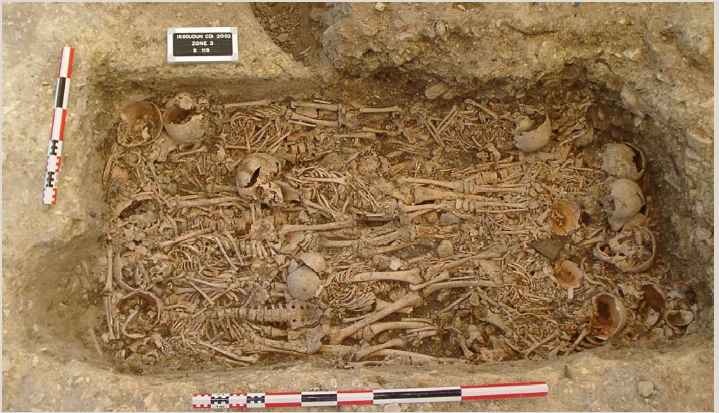
3. Vue verticale d'une sépulture multiple et restitution graphique de la dynamique des dépôts dans la sépulture.