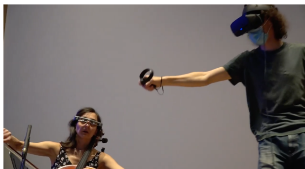
Figure 3. INScore embarqué sur des lunettes EPSON bt-350 (à gauche), dans la pièce ‘Fantaisie, Querying Schumann’s op.73’ (J. Bell, 2021)

Cela s’est avéré pratique à des fins de débogage, et a révélé un affichage confortable pour l’utilisateur. La version native Android de INScore a obtenu des résultats stables. L’inconvénient des lunettes EPSON bt-350, pour les tests basés sur un navigateur, est qu’elles ne parviennent pas actuellement à charger les pages html servies par DRAWSOCKET, INScoreWeb ou SmartVox.