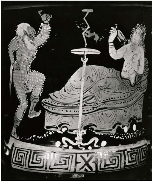
Fig. 3 – Femme joueuse de kottabos et satyre dansant. Cratère en calice apulien à figures rouges, attribué au Schlaepfer Painter, provenant de Capoue, vers 360-350 av. J.-C. Londres, British Museum (inv. 1873,0820.345), n° photo 667925001