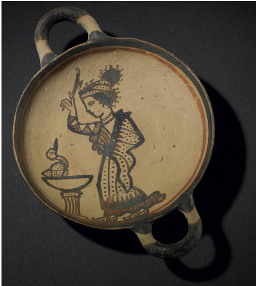
Fig. 1 – Joueuse de Kottabos visant un canard flottant dans un loutērion. Kylix corinthienne à figures noires, attribuée au Sam Wide Group, découverte à Tanagra, vers 450-400 av. J.-C. Londres, British Museum, n° E 813 (inv. 1873,0915.9), n° photo 883938001