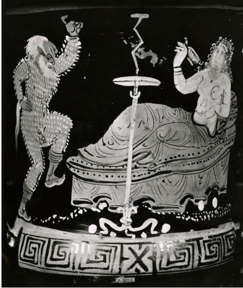
Fig. 3 – Femme joueuse de kottabos et satyre dansant. Cratère en calice apulien à figures rouges, attribué au Schlaepfer Painter, provenant de Capoue, vers 360-350 av. J.-C. Londres, British Museum (inv. 1873,0820.345), n° photo 667925001