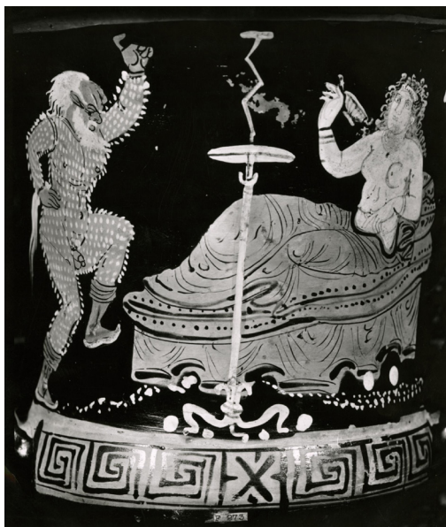
Fig. 3 – Femme joueuse de kottabos et satyre dansant. Cratère en calice apulien à figures rouges, attribué au Schlaepfer Painter, provenant de Capoue, vers 360-350 av. J.-C. Londres, British Museum (inv. 1873,0820.345), n° photo 667925001