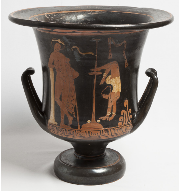
Fig. 8 – Cratère en calice apulien à figures rouges attribué au Peintre de Rohan, vers 380-370 av. J.-C., provenant de Fasano. Gênes, collection Odon de Savoie, Museo di Archeologia Ligure (inv. 1142).

presque toucher le disque médian du kottabos de son pied gauche renversé. À la base du kottabos agrémenté d'une bandelette se trouvent deux sphères posées au sol. Cet assemblage est observé par un jeune homme couronné, tenant un bâton de son bras gauche enroulé dans un himation et appuyé du coude droit sur un pilier évoquant la palestre. S'agit-il ici, par un savant jeu de correspondances, d'évoquer par métonymie le spectacle des sens, distraction du citoyen, en déclinant de manière synthétique l'équilibre, presque chorégraphié, en jeu dans ces pratiques ? La syntaxe de l'image semble reposer sur un double système d'association – souplesse et habileté nécessaires au mouvement contrarié de l'acrobate et à la gestualité caractéristique du kottabos – et d'opposition, entre le citoyen et l'amuseur à la marge de la société civique.