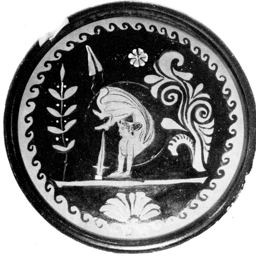
Fig. 9 – Plat apulien à figures rouges attribué au Groupe de l'Alabastre, vers 330-325. Washington DC, Collection John Gomperts & Katherine Klein, d'après RVAp II, 21 / 46, pl. 234.1

Un plat apulien ( fig. 9 ) met en scène une acrobate vêtue d'une longue jupe aux plis gonflés, effectuant la culbute canonique appuyée sur les mains, tandis que l'un de ses pieds vient effleurer la pointe de l'épée plantée sur une ligne de sol 162 . Une bandelette est suspendue dans le champ, rempli par ailleurs de rameaux de végétaux stylisés. La dynamique interne proposée par le peintre semble jouer sur la circularité du plat et de son médaillon, à laquelle répond la posture courbe de la figure centrale. La forme particulière du vase, animée au centre d'un léger ressaut correspondant au départ du pied, accroche la lumière d'une manière particulière. Le vase, dont il faut imaginer la manipulation – qui selon l'angle de réflexion de la lumière fait briller le vernis –, semble intégrer le corps de la figure à partir des avant-bras au sein d'un cadre circonscrit, qui par un jeu d'équivalence pourrait évoquer le cerceau.