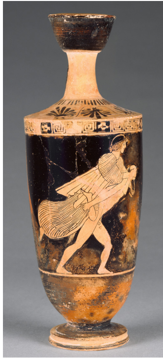
Fig. 5 – Lécythe attique à figures rouges, attribué à l'atelier du Peintre de Carlsruhe, vers 470-460 av. J.-C. Malibu, Getty Museum, n° 71.AE.444.

Cet exemple se distinguerait néanmoins au sein de la série des scènes d' ephedrismos par sa technique à figures noires, son cadre, son mobilier, sa dimension collective, ainsi que par les attitudes et représentations corporelles de ses figures, qui renvoient clairement à l'iconographie du symposion et du kômos attiques 123 . À droite de la scène, un convive est couché par terre, son bras gauche appuyé sur un coussin, à la manière donc d'un participant au symposion . Au-dessus de lui, un groupe de deux cômastes est engagé dans une possible scène d' ephedrismos pour le moins inhabituelle. Le porteur accueille, dans la boucle formée par ses mains jointes dans le dos, le genou de son compagnon, qui lui enserme le cou. Si la gestuelle est caractéristique du jeu, elle est néanmoins détournée. Le cavalier tient en effet une couronne de banqueteur de la main gauche, le genou accueilli n'est ensuite pas le bon, et pour