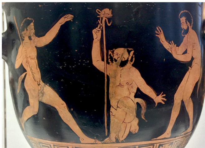
Fig. 4 – Satyres jouant avec une souris, cratère en cloche lucanien attribué au Peintre de Brooklyn-Budapest, Moscou, Musée Pouchkine, II. 1B 734, vers 380-370 av. J.-C; photo A. Attia