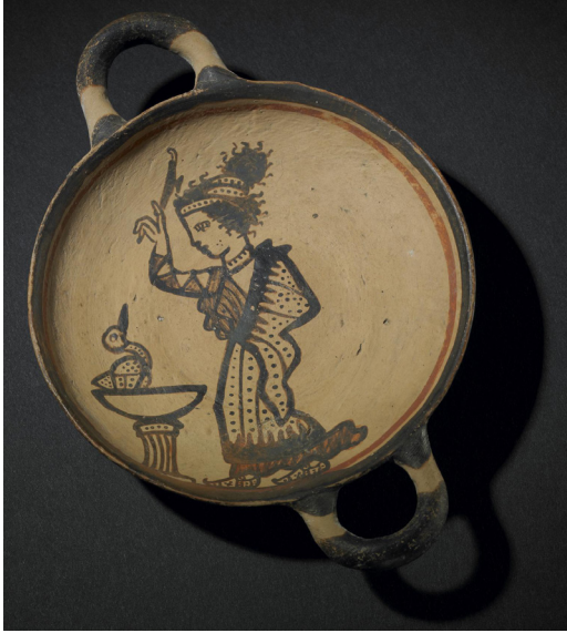
Fig. 1 – Joueuse de Kottabos visant un canard flottant dans un loutērion. Kylix corinthienne à figures noires, attribuée au Sam Wide Group, découverte à Tanagra, vers 450-400 av. J.-C. Londres, British Museum, n° E 813 (inv. 1873,0915.9), n° photo 883938001