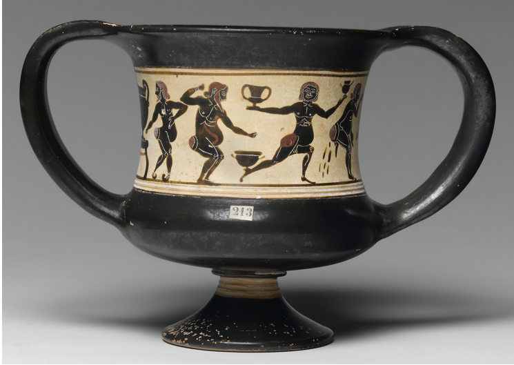
Fig. 10 – Canthare laconien à figures noires, attribué à l'atelier du Peintre de la Chasse, vers 550-540 av. J.-C. Paris, Musée du Louvre, n° MNE1324

à cet équilibriste est en effet proposé à sa droite ; incapable de se tenir, ce cômaste en position semi-accroupie, les parties génitales surdimensionnées et coincées entre ses cuisses 169 , défèque en direction de son collègue un peu trop fier. Une fois n'est pas coutume, le cratère à gauche de la scène en constitue la clef de lecture ; il est la source du vin. Les attitudes différentes des cômastes ne sont que des variations au sein de la gamme des états d'ébriété qui guettent le buveur 170 .