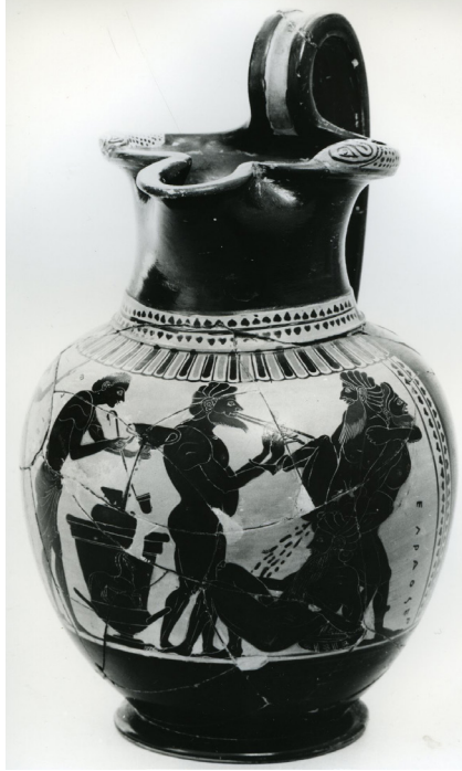
Fig. 6a – Cenochoé attique à figures noires, attribuée à Kleisophos, vers 575-525 av. J.-C. Athènes, Musée Archéologique National, n° 1045