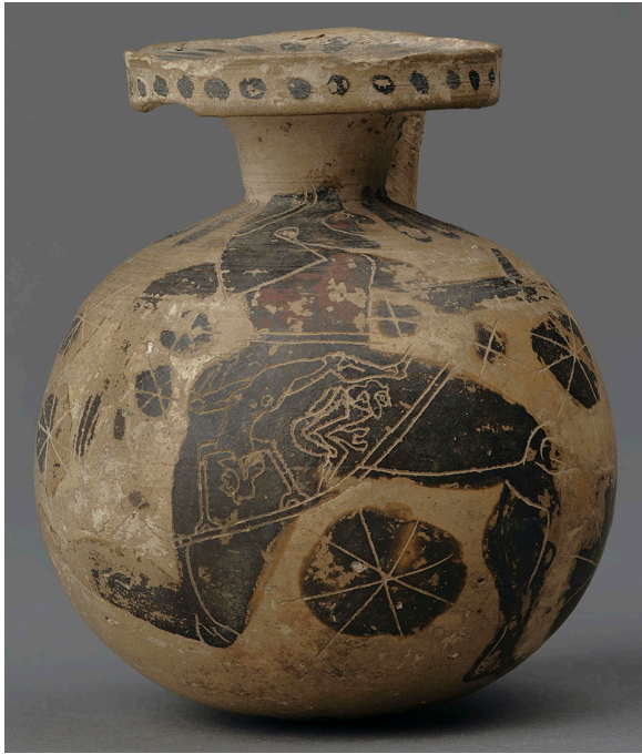
Fig. 7 – Personnage courant avec des acrobates incisés sur son chiton . Aryballe globulaire corinthien à figures noires, Corinthien ancien à moyen (620-570). Oxford Ashmolean Museum, n° AN1928.315

Un cratère à colonnettes corinthien à figures noires de la fin du VII e siècle présente une association similaire 138 . Au niveau de l'épaule, au milieu d'une frise de cinq padded dancers , deux des cômastes sont penchés en avant, un bras appuyé sur le sol ; de leurs postérieurs, appuyés l'un contre l'autre, deux traînées croisées de points vernis semblent indiquer une défécation 139 . Leurs yeux sont tournés vers le haut, en direction d'un cinquième personnage qui, à l'horizontale, saute par-dessus le binôme d'une pirouette acrobatique.