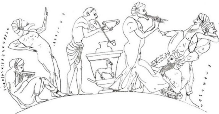
Fig. 6b – Dessin Tsingarida 2009, 107, fig. 3, mise au net par N. Bloch – CreA