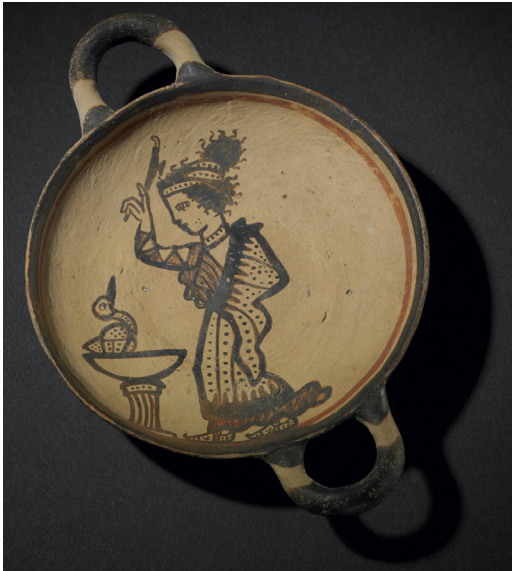
Fig. 1 – Joueur de Kottabos visant un canard flottant dans un loutērion. Kylix corinthienne à figures noires, attribuée au Sam Wide Group, découverte à Tanagra, vers 450-400 av. J.-C. Londres, British Museum, n° E 813 (inv. 1873,0915.9), n° photo 883938001