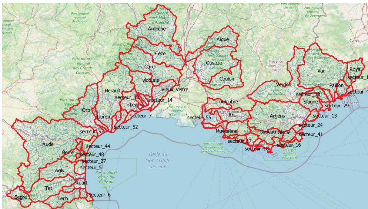
Figure 1 : Carte des secteurs traités (en rouge les contours de bassin versant ou secteurs côtiers)

Un rapport détaillé sur cette action a été produit ( voir documents annexes ). Les cartes d'emprises inondées et de hauteurs d'eau sont mises à disposition sur un site FTP.