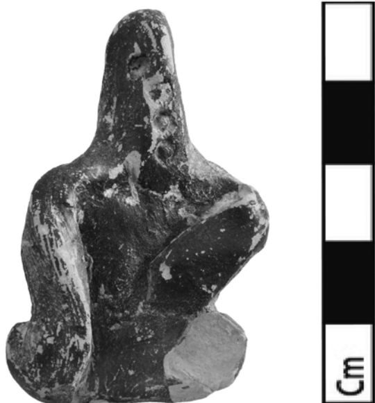
Fig. 9 – Figurine masculine nue, accroupie et ithyphallique ; Acropole de Sparte.

L'approche comparative de ces productions modelées ithyphallics entre les grands sanctuaires spartiates a été complètement bouleversée par les fouilles de Tsakona. Les 2740 figurines modelées découvertes constituent, de très loin, la première catégorie d'offrandes votives 58 et représentent dans 80 % des cas des personnages ithyphallics. D'une taille toujours inférieure à 8 cm, elles arborent un nez et un menton réalisés au moyen d'un pincement de l'argile entre le pouce et l'index, tandis que les traits du visage, voire les doigts des pieds et des mains, sont rendus par des incisions. On retrouve donc les mêmes techniques que celles employées pour les groupes d'Orthia, mais l'argile utilisée est la même que celle employée pour la céramique vernie et figurée et les traces de vernis noir rapprochent ces productions de celles du Ménélaion. La nuance a son importance, car cette argile n'étant utilisée qu'à partir du VI e siècle, les données du Ménélaion et, plus encore, celles de Tsakona, permettent d'étendre la datation de ces types ithyphallics au cours du VI e siècle. La découverte de l'essentiel de ces figurines dans le « Building 2 », au sein d'une couche contenant des aryballes miniatures, conforte cette datation.