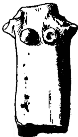
Fig. 5 – Type « colonne » féminin doté d'une poitrine ; Acropole de Sparte ( Woodward 1928, 83, fig. 4.21 ).