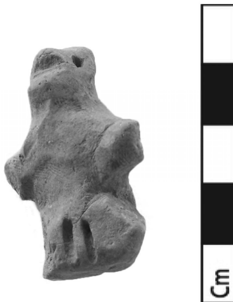
Fig. 6 – Figurine féminine nue, accroupie et exhibant ses « pudenda » ; Amyklaion. Amykles Research Project N°AM/Π47. Inédit / non-publié.