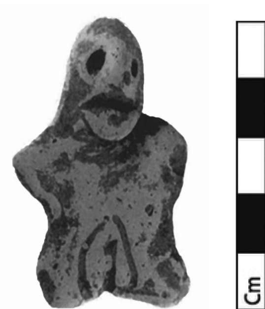
Fig. 7 – Figurine féminine nue, accroupie et exhibant ses « pudenda » ; Tsakona. ( Catling et al. 1996, pl. 12a ).