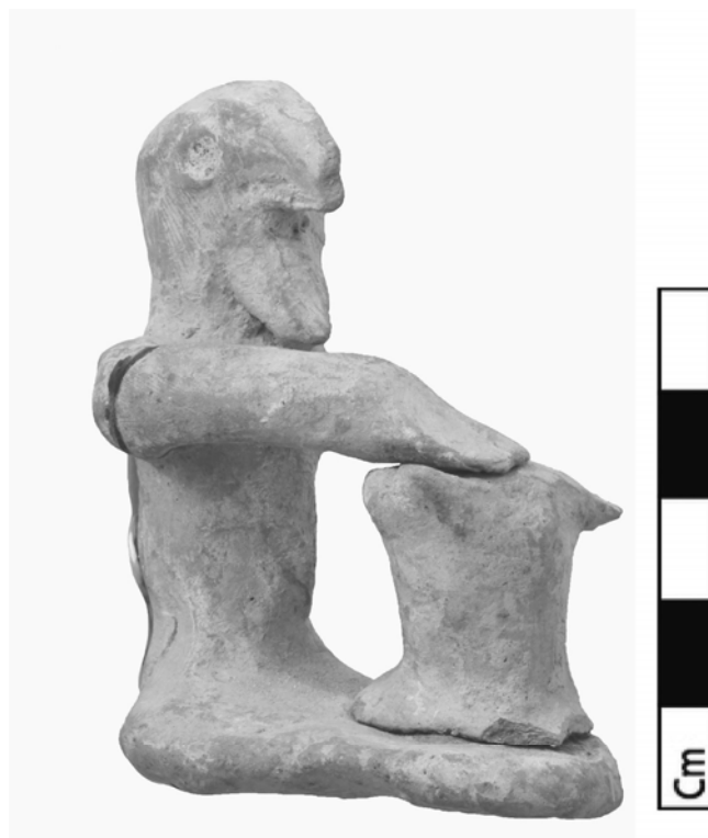
Fig. 4 – Type XIII.A10 des « boulangers » ; Orthia.

fin du VII e siècle, réalisées en argile blanche 29 . Cette dernière ne correspond pas aux lits d'argile connus en Laconie, ce qui a amené les fouilleurs britanniques à la conclusion que ces objets avaient été importés. Un autre groupe de cavaliers, daté de la fin du VI e et du V e siècle (C) est également attesté au Ménélaion 30 . Cette datation plus tardive est confirmée par l'observation de l'argile et des modes de cuisson. L'argile utilisée est rouge, sableuse et friable ; elle ne présente ni les mêmes qualités de composition, ni la même cuisson que les figurines antérieures sur le site. Ces différences traduisent l'utilisation d'une argile et de techniques différentes de celles utilisées pour la céramique fine laconienne 31 , signe potentiel du déclin supposé de ces productions modelées après le VI e siècle. Enfin, alors que le sexe des figurines de cavaliers est généralement présumé masculin, ces exemplaires tardifs du Ménélaion présentent un contrepoint intéressant. Les cavaliers de ce sanctuaire consacré au culte de Ménélas et d'Hélène y chevauchent en effet parfois leur monture de côté,