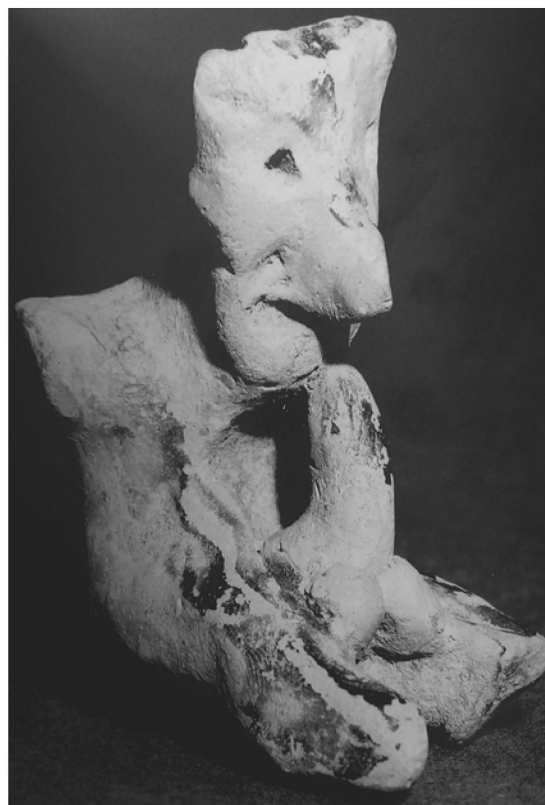
Fig. 8 – Figurine masculine nue, accroupie et ithyphallique ; Orthia. Ashmolean Museum, Oxford. Inv. n° AN1923.165.a, h = 5,8 cm ; l = 4 cm. ( Vafopoulou-Richardson 1991, 12-13, fig. n° 12, pl. 7A ).