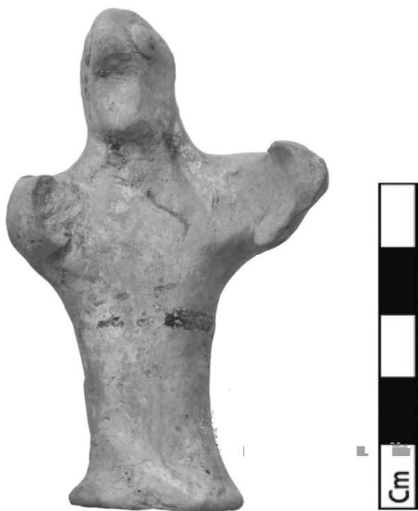
Fig. 3 – Type XIII.A1 masculin ; Orthia.

à un corps en colonne, qui s'évase pour fournir une base stable à la figurine, sur le modèle des figurines mycéniennes en Ψ et en X 22 . Les visages ne possèdent généralement pas de signes distinctifs, mais de rares exemplaires présentent néanmoins un souci d'individualisation, comme dans le cas des personnages aux traits simiesques 23 .