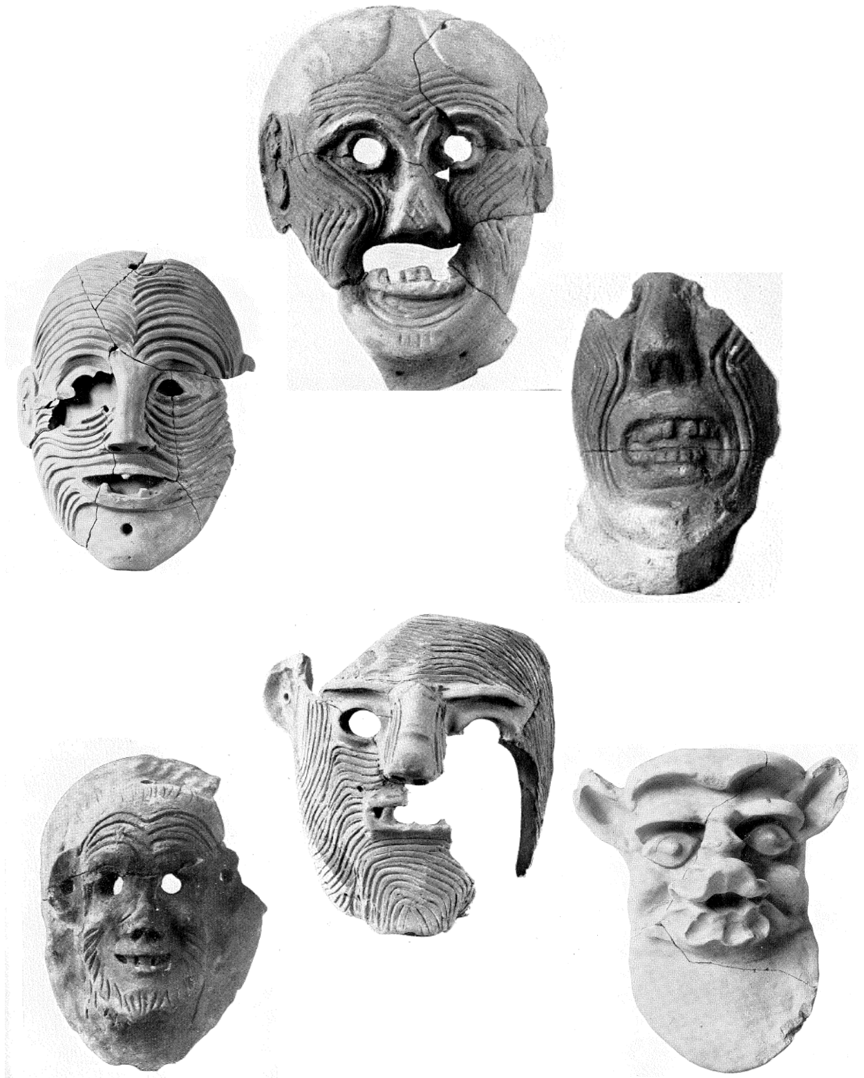
Fig. 1 Masques de terre cuite du sanctuaire d'Artémis Orthia. G. Dickins, « The terracotta masks », dans R.M. Dawkins, The sanctuary of Artemis Orthia at Sparta, excavated by the British School at Athens , London, 1929, pl. 47-49.