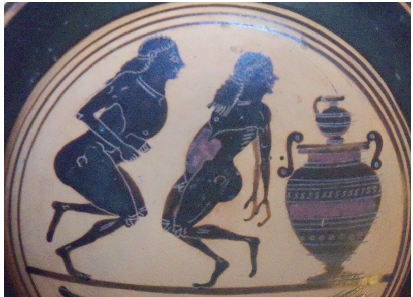
Fig. 2 Coupe laconienne 192 du Cabinet des Médailles de la BNF. Peintre de la Chasse, vers 550-530 av. J.-C.