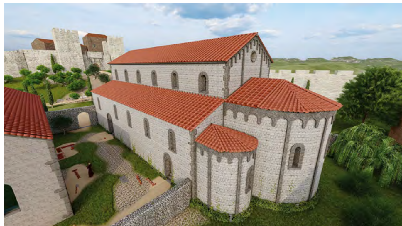
Fig. 49 – NICE, Colline du Château. Restitution 3D de la cathédrale du XI e siècle, vue orientale (A. Troconis-Noblet/SANCA).

La découverte de près de 40 sépultures sous tegulae permet d'envisager une étude sur ces terres cuites architecturales dont le corpus avoisine à présent les 500 individus. La persistance du mode d'inhumation sous bâtière de tuiles à l'époque médiévale a bien été montré tant par la stratigraphie qu'avec les résultats de datation radiocarbone des individus inhumés. En revanche, il restait à démontrer que les tegulae remployées comme couverture de sépultures n'étaient pas forcément antique. Une trentaine de tests d'ancienneté par thermoluminescence a été réalisée sur les tuiles. Les résultats ont montré la continuité de la production de terres cuites architecturales jusqu'à des périodes tardives (milieu du XIII e siècle). Ils ont mis en évidence trois groupes chronologiques : Antiquité, haut Moyen Âge et Moyen Âge. Devant cette riche documentation inédite, une étude globale portant aussi bien sur les critères métrologiques, typologiques que sur les traitements de surface et les pâtes a été réalisée afin de mettre en évidence les critères qui pourraient discriminer des groupes. Les résultats de l'étude ont montré une distinction entre le groupe attribué à l'Antiquité et ceux du haut Moyen Âge et du Moyen Âge.