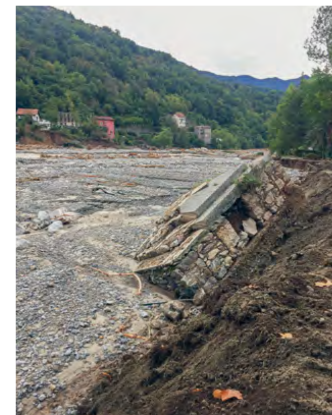
> Fig. 52 – ROQUEBILLIÈRE, Église Saint-Michel-de-Gast. Vue du monument aux morts emporté dans la rivière.