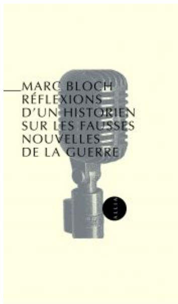
Couverture de l'édition de 1999 de Réflexions d'un historien sur les fausses nouvelles de la guerre (Paris, Éd. Allia)