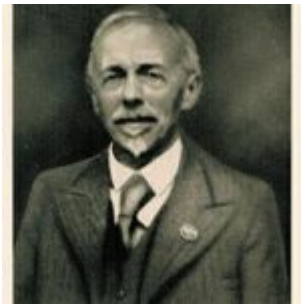
Portrait d'Albert Dauzat ( https://la13regionmilitaire.pagesperso-orange.fr/Files/Image/Photo/220px-Albert_Dauzat_(1877-1950).jpg )