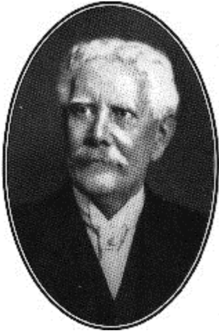
Portrait de Charles William Chadwick Oman ( https://en.wikipedia.org/wiki/File:Charles_Oman.png )