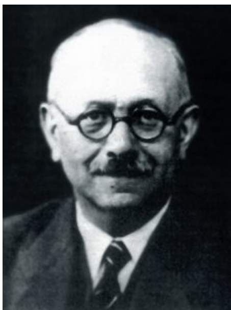
Portrait de Marc Bloch ( https://commons.wikimedia.org/wiki/File:Marc_Bloch.jpg )

Il s'agit d'un raccourci afin de stimuler un désir de lecture et un acte d'achat. Pour autant, il signale que la leçon du futur cofondateur, avec Lucien Febvre (1878-1956), de l'École des Annales est en prise avec nombre de questions que pose l'étude des publics. On remarque aussi d'emblée que M. Bloch raisonne en termes de processus, de transmission ou, pour le dire avec un vocabulaire plus contemporain, de médiation. C'est dire que son propos a une portée épistémologique qui croise plusieurs des préoccupations du Publictionnaire . Et ce propos est ancré dans l'expérience du patriote et combattant de la Grande Guerre ; il l'est également dans celle du chercheur qui avance dans sa carrière et se positionne par rapport à ses pairs : M. Bloch vient de soutenir sa thèse en 1920 ( Rois et serfs, un chapitre d'histoire capétienne ) dans des conditions réservées aux anciens combattants (Fink, 1989 : 83/84) et il enseigne à l'université de Strasbourg redevenue française. Pour prendre la mesure de cet ancrage, des repères biographiques sont utiles, même si l'historien n'était guère friand de cette façon de faire.