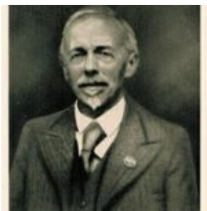
Portrait d'Albert Dauzat ( https://la13regionmilitaire.pagesperso-orange.fr/Files/Image/Photo/220px-Albert_Dauzat_(1877-1950).jpg )