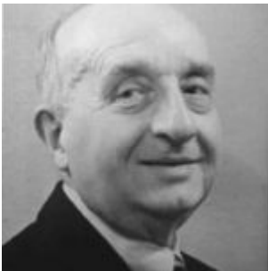
Portrait de Lucien Graux