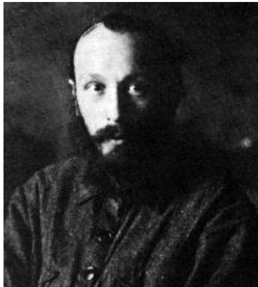
Illustration 1. Portrait de Mikhaïl Bakhtine

Mikhaïl Mikhaïlovitch Bakhtine (1895-1975) est un théoricien russe de la littérature et du langage. Sa pensée, riche, complexe et souvent fascinante, a introduit des ruptures épistémologiques majeures et des concepts heuristiques féconds, aussi bien dans la poétique des discours que dans l'anthropologie de la culture ou la philosophie du sujet (Bakhtine, 1986). Mikhaïl Bakhtine a d'abord été connu en Occident pour ses travaux sur le roman et sur la culture populaire. Ce n'est pas ici le lieu de revenir sur les débats légitimes que suscitent la notion de « culture populaire » et le concept de « peuple », mais on peut rappeler que Mikhaïl Bakhtine – malgré toute sa science, son érudition et sa sagacité extrême – n'a longtemps disposé que d'un corpus limité d'œuvres et inscrivait sa réflexion sous contrainte de la domination stalinienne. Signalons aussi la difficulté pour les spécialistes de distinguer parmi les publications signées Bakhtine celles qui sont effectivement de sa plume et celles qui relèveraient plutôt d'un cercle d'intellectuels proches et brillants, tels Valentin Nikolaïevitch Volochinov (1895-1936) ou Pavel Nikolaevič Medvedev (1892-1938) (Todorov, 1981).