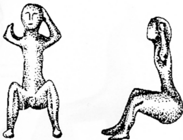
Fig. 5. Le cavalier de Stradonice (d'après WALDHAUSER 2001, 22)

torse est sans marque particulière. Les épaules sont tombantes. Le cou est élancé. La tête glabre sans oreilles est une sphère tranchée pour la face. Le visage ovale, au menton rond, est plat et même légèrement concave vers le centre. La bouche droite est esquissée. Le nez fort est une longue forme rectangulaire. Les yeux petits et ronds sont creusés près de la racine du nez. Les arcades sourcilières sont épaisses et le front inexistant. Le léger relief sur la périphérie peut faire penser à une barbe.