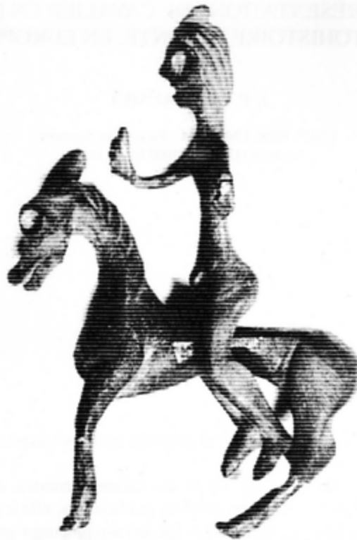
Fig. 1. Le couple cheval-cavalier de Bas-en Basset (d'après catalogue du musée Crozatier du Puy-en-Velay, France)

Le personnage nu est dans la position du cavalier, tête et buste droits, membres supérieurs détachés du corps, cuisses écartées, genoux fléchis, pieds à la perpendiculaire des jambes aux forts mollets. Les doigts de pieds sont marqués et le sexe est bien visible. Son long torse se termine par un large bassin. Le bras droit, cylindrique, sans marque du coude et levé vers l'avant, se termine par une main surdimensionnée au pouce écarté et levé, à l'angle souligné. Les quatre autres doigts sont aussi bien dessinés. Le bras gauche, abaissé, coupé au niveau du coude, se termine par un téton de fixation destiné à tenir un bouclier. Le cou long porte une tête massive. Le menton est rond, la bouche large et entrouverte. Le nez droit rejoint des arcades sourcilières droites et épaisses. Les yeux sont aussi de grandes cavités vides un peu effrayantes, sans doute destinées à être garnies d'une substance d'une autre couleur. Les oreilles ne sont pas figurées. Sur le crâne, deux bandes autour d'une forme en calotte limitent la face et couvrent la nuque. Dans l'axe du nez, au bord de la calotte, se trouve une protubérance rectangulaire. Cet accessoire toujours interprété comme une coiffure ou un chapeau est pour nous plutôt un casque avec deux pointes dans le prolongement du nez et la base soulignée par deux larges rubans martelés. Des incisions marquent les jonctions pieds-jambes, mains-avant-bras et torse-bassin.