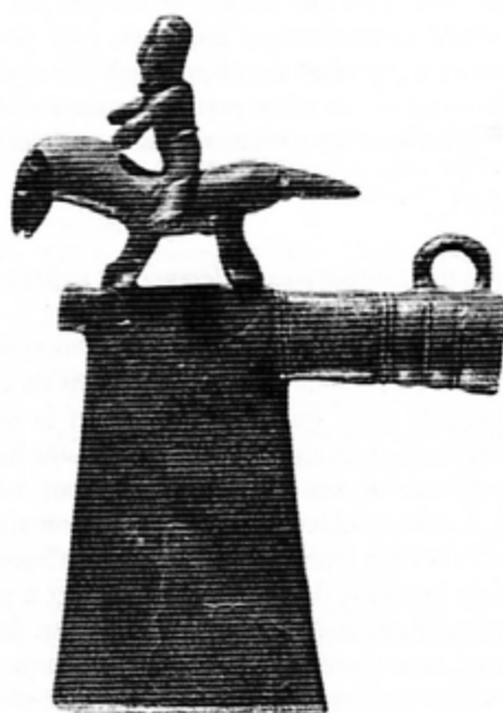
Fig. 9. Le cavalier de la tombe 641 de Hallstatt (d'après KROMER 1959)

esquissés, semble tenir des rênes figurées par deux lignes de stries sur l'encolure. Le bras droit, détaché, tombe en arrière comme s'il jouait de la badine ou cravache pour le faire avancer. L'ensemble, très en mouvement, rappelle un cavalier en compétition. 15