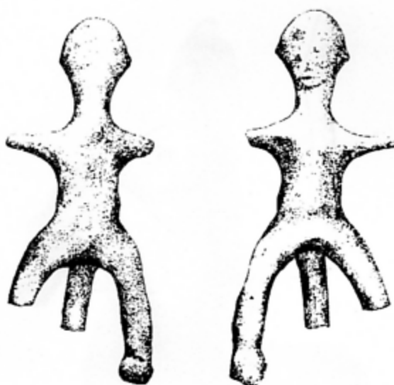
Fig. 3. Le cavalier de Batina (d'après TODORVIĆ 1974, 103, fig. 81)