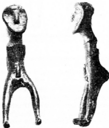
Fig. 4. Le cavalier de Zsámbeč (d'après SZÁNTÓ 1951)

élané. La tête glabre porte les ébauches de deux oreilles asymétriques triangulaires. Sur la face ovale au menton rond, la bouche droite est une simple entaille. Le nez et les yeux ronds sont esquissés. Cette pièce, par ses défauts, son état de surface, son mauvais rendu des formes et ses bras effilés nous fait penser qu'il s'agit d'un raté de fonderie ayant conservé son jet de coulé, l'appendice fixé après la fabrication de la statue en cire au niveau de l'entre jambe.