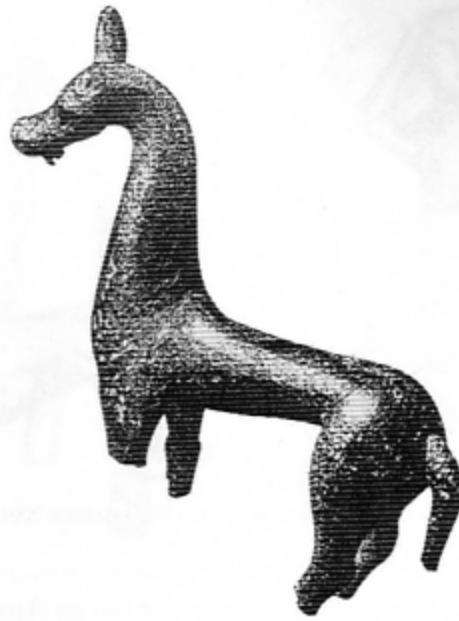
Fig. 6. Le cheval de Freisen (d'après JACOBSTHAL 1944, pl. 74)