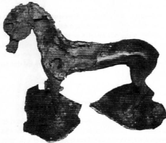
Fig. 7. Le cheval de Guerchy (d'après GIRARD 2003)

crinière. Le corps est rond et allongé, la queue longue et fine. Les pattes avant, raides, se terminent par des sabots plus ou moins bien rendus et les pattes arrière aux genoux marqués sont infléchies vers l'intérieur. Les cavaliers, nus, asexués, coiffés d'un casque conique, portent un bouclier et, dans l'autre main, un court bâton. 14