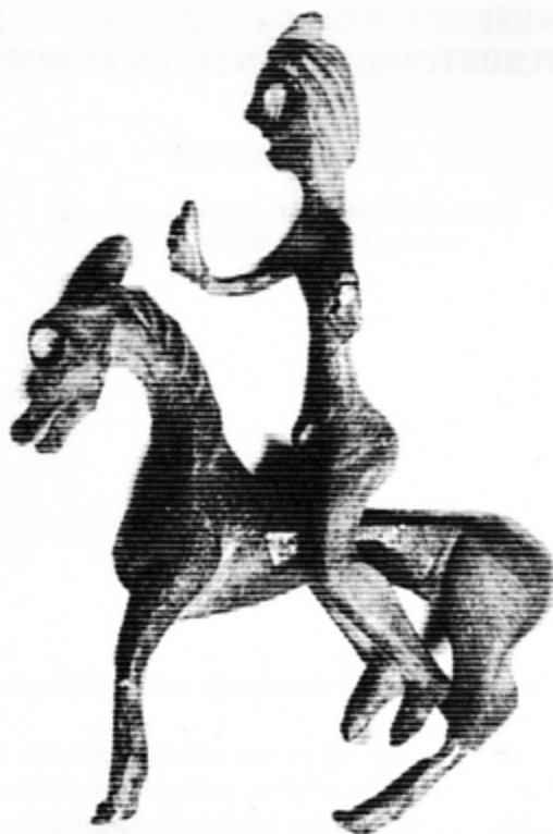
Fig. 1. Le couple cheval-cavalier de Bas-en Basset (d'après catalogue du musée Crozatier du Puy-en-Velay, France)

Le personnage nu est dans la position du cavalier, tête et buste droits, membres supérieurs détachés du corps, cuisses écartées, genoux fléchis, pieds à la perpendiculaire des jambes aux forts mollets. Les doigts de pieds sont marqués et le sexe est bien visible. Son long torse se termine par un large bassin. Le bras droit, cylindrique, sans marque du coude et levé vers l'avant, se termine par une main surdimensionnée au pouce écarté et levé, à l'ongle souligné. Les quatre autres doigts sont aussi bien dessinés. Le bras gauche, abaissé, coupé au niveau du coude, se termine par un téton de fixation destiné à tenir un bouclier. Le cou long porte une tête massive. Le menton est rond, la bouche large et entrouverte. Le nez droit rejoint des arcades sourcilières droites et épaisses. Les yeux sont aussi de grandes cavités vides un peu effrayantes, sans doute destinées à être garnies d'une substance d'une autre couleur. Les oreilles ne sont pas figurées. Sur le crâne, deux bandes autour d'une forme en calotte limitent la face et couvrent la nuque. Dans l'axe du nez, au bord de la calotte, se trouve une protubérance rectangulaire. Cet accessoire toujours interprété comme une coiffure ou un chapeau est pour nous plutôt un casque avec deux pointes dans le prolongement du nez et la base soulignée par deux larges rubans martelés. Des incisions marquent les jonctions pieds-jambes, mains-avant-bras et torse-bassin.