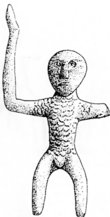
Fig. 2. Le cavalier de Kladovo (d'après TODOROVIĆ 1974, 101, fig. 78)