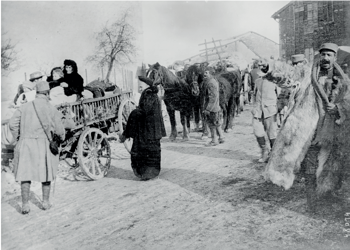
Illustration 1 Colonnes de réfugiés des combattants de la Meuse

Incapable de tout emporter, elle songe un temps à l'autodafé afin de prévenir toute profanation de ces fragments d'intimité au rang desquels figure la photographie de son frère Arthur en premier communiant, qu'elle glisse dans son corsage pour l'emporter sur son cœur 36 . Cette volonté de raccorder le futur au présent explique le caractère hétéroclite de ces « chars antiques » laissant apparaître, au milieu du fatras, « ce cadre d'un mariage ; un fiancé aux cheveux lissés, une fleur d'oranger sous cloche de verre 37 ».