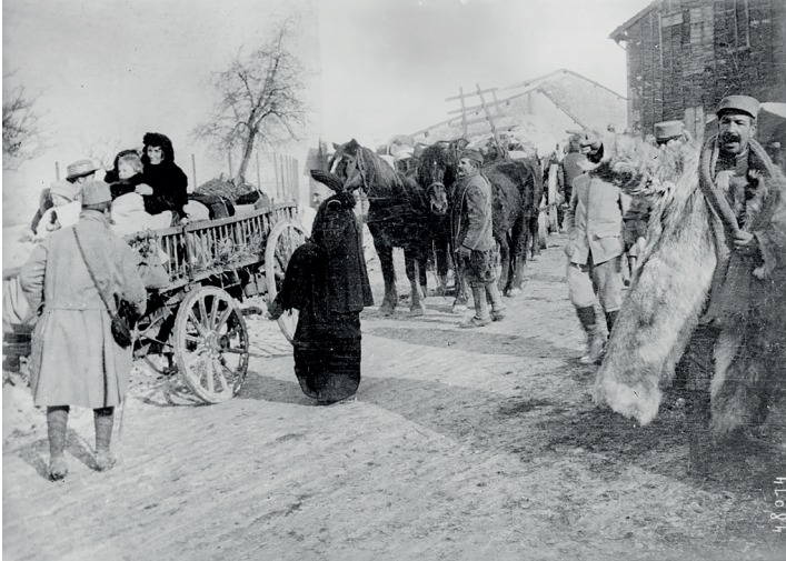
Illustration 1 Colonnes de réfugiés des combattants de la Meuse