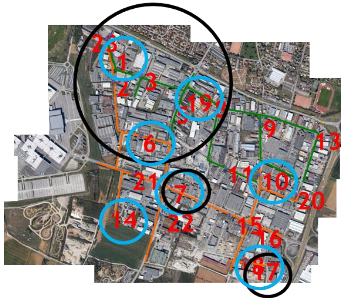
Figure 3 : Distribution des Pseudomonas aeruginosa (zone entourée en noir) et sites fortement contaminés en Escherichia coli (zones bleues) au niveau du bassin versant industriel du projet. Cette analyse suggère une répartition différenciée des P. aeruginosa en fonction des zones d'activités.