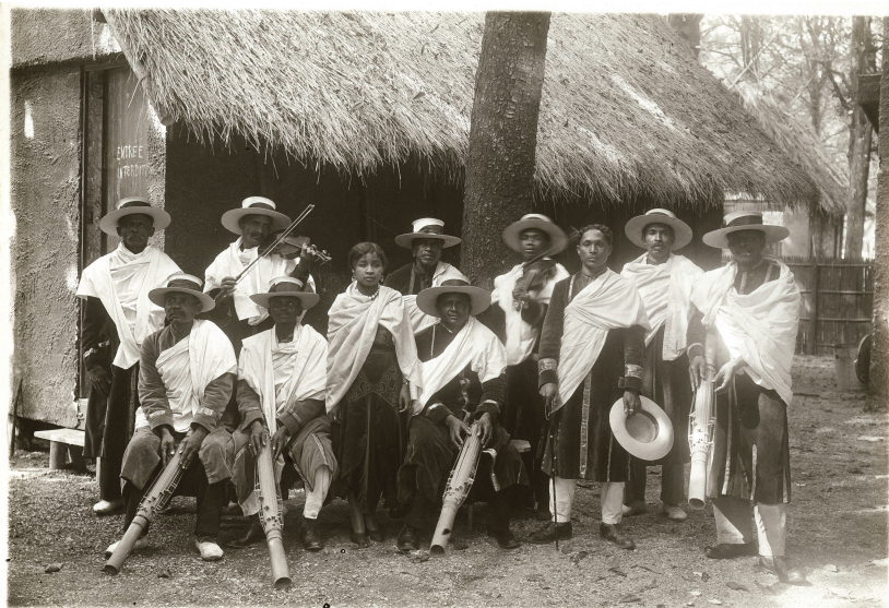
Exposition coloniale internationale, 1931. Madagascar : Tery Mafy loatra my saïna [Enregistrement sonore] : chant de nostalgie / Chœur, six valihas, ensemble instrumental.

Les enregistrements effectués lors de l'Exposition coloniale internationale de 1931 sont consultables en ligne :