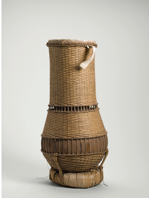
Tambour (Bénin), donné par Gilbert Rouget, 71.1959.69.5