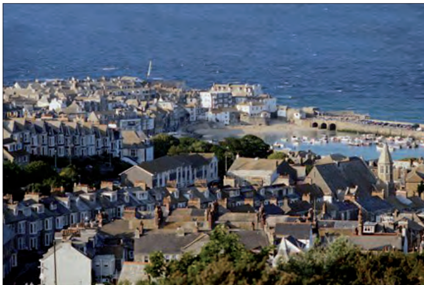
4. Le port de St Ives, Cornouailles.

Même si cette distribution géographique comporte de nombreux lieux fictifs, ceux-ci sont souvent localisables car fortement inspirés par la vie d'Agatha Christie. Ainsi, Dillmouth ( La dernière Énigme , 1976) et Saint Loo ( La Maison du péril , 1932 ; Les Vacances d'Hercule Poirot , 1941) sont directement inspirés de Torquay (où l'auteur est née, fig. 5 ) et de Dartmouth, deux stations balnéaires du Devon. Par conséquent, elle apprécie fortement ces « petits villages du Sud de l'Angleterre et leurs manoirs car, comme Balzac ou Proust, elle peint une atmosphère qu'elle connaît de l'intérieur. » (Mijolla-Mellor, 1995).