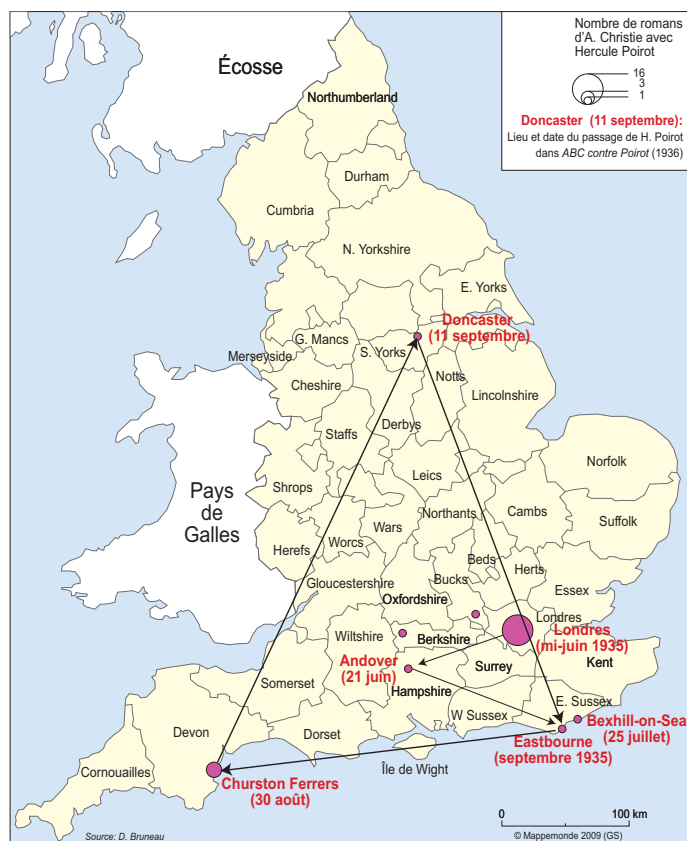
3. Localisation des romans avec Hercule Poirot

De fait, loin de souscrire entièrement à la tradition urbaine du roman policier, Agatha Christie tente de rendre palpitante une enquête à l'ampleur parfois régionale (dans Une mémoire d'éléphant , 1972, par exemple) mais qui trouve régulièrement sa conclusion depuis un fauteuil dans le cadre d'un huis clos.