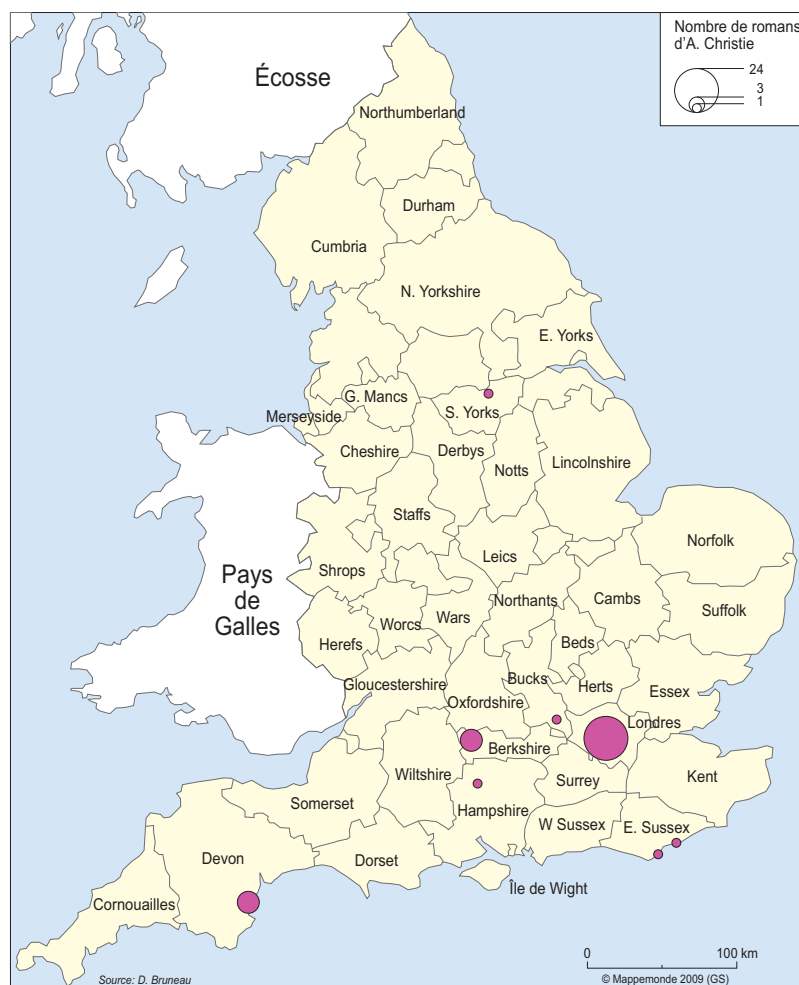
2. Les régions où se situe l'action des romans d'Agatha Christie