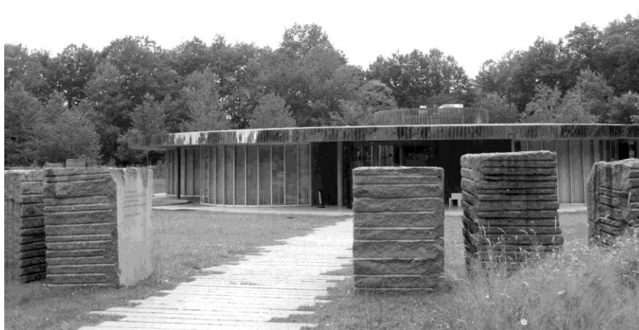
Figure 3 – Le crématorium de Vern-sur-Seiche

vement sélectionné : les espaces forestiers, aquatiques ou sportifs ainsi que les hauteurs d'une ville sont privilégiées. Cet ensemble de données typologiques peut comporter des contradictions par rapport au cahier des charges d'un futur exploitant : la proximité d'un cimetière ancien sous-entend celle d'habitations et donc des difficultés d'accès. Dès lors, les derniers crématoriums plus grands et avec parkings implantés à la limite entre ville et campagne peuvent être finalement rattrapés par l'urbanisation et voir leur écrin de verdure être fortement réduit.