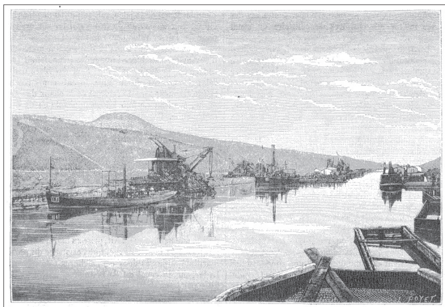
Fig. 2. - Louis Poyet, « Creusement du canal maritime de Suez. L'excavateur Couvreux dans la grande tranchée d'El-Guisr »

Cette dernière s'impose pour l'ensemble des travaux : d'abord, avec l'installation de machines à vapeur fixes et de locomobiles qui fournissent la force nécessaire au fonctionnement de certains ateliers ou de machines, animées par l'intermédiaire de courroies ; ensuite, avec l'emploi d'équipements disposant de leur propre moteur à vapeur ; enfin, avec la construction de centaines de kilomètres de voies ferrées légères et démontables, parcourues par des trains à vapeur pour acheminer des matériaux et évacuer les déblais. Ces machines doivent être suffisamment robustes et régulièrement entretenues, graissées et révisées pour fonctionner de manière optimale dans le désert, avec un environnement marqué par la poussière de sable et de forts écarts de températures. Voisin est également attentif à ce que l'alimentation en eau douce et l'approvisionnement de combustible soient continus (Fig. 2).