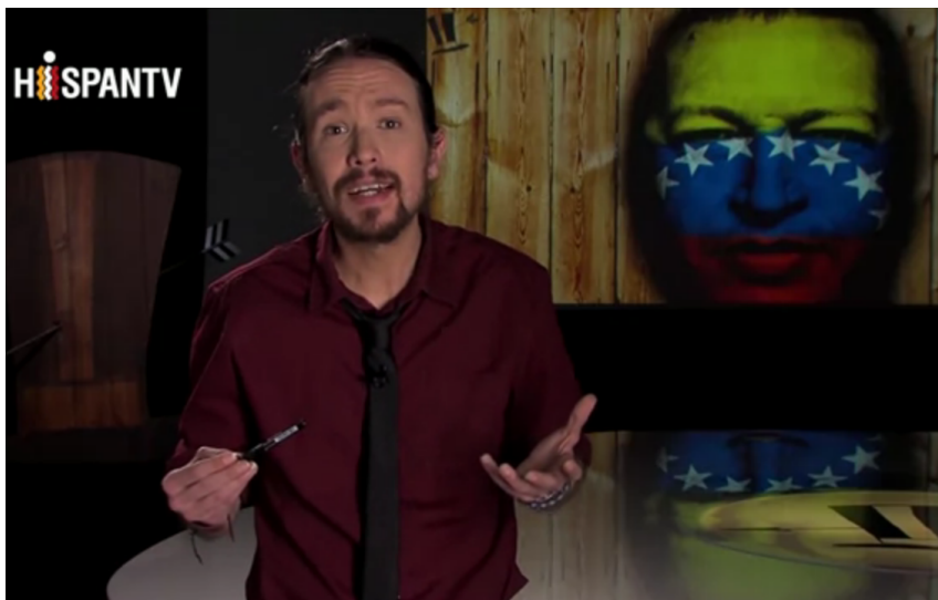
Figura 1: Imagen del monólogo introductorio a la Tertulia Política «Fort Apache», –derivada de «La Tuerka»– en HISPANTV.

Juan Carlos Monedero ha articulado su crítica al sistema en tres vertientes: la crítica al sistema occidental devorado por el capitalismo (Monedero Fernández-Gala; 2009a y 2009b); la crítica al Sistema Político de España surgido de la Transición de 1978 y su