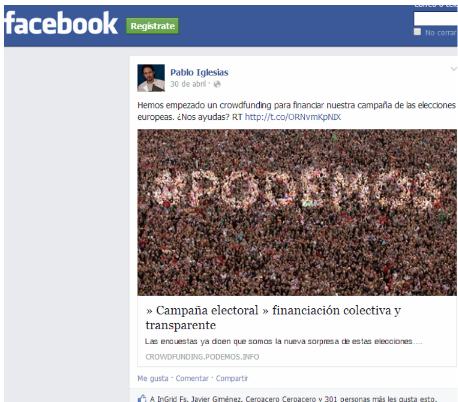
Figura 5: llamamiento de financiación pública por parte de Pablo Iglesias para la campaña de PODEMOS el 30 de abril de 2014.

también los predominantes. La gente NO busca en Internet lo que no conoce. 16 Y la campaña de Pablo Manuel Iglesias Turrión se realiza con su impacto en las televisiones Cuatro y La Sexta. En la Web Social Twitter la cuenta del candidato @Pablo_Iglesias_ duplica sus seguidores tras su elección como Eurodiputado en las urnas, pasando de doscientos veintidós mil a cuatrocientos cuarenta mil en tan sólo una semana, y llegando a superar los quinientos mil a finales de julio de 2014.