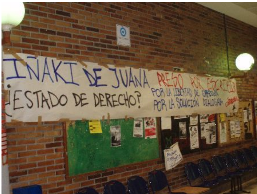
Figura 2: Imagen de la pancarta colgada en el pasillo de acceso a la Biblioteca de la Planta Baja de la Facultad de Ciencias Políticas y Sociología de la UCM.