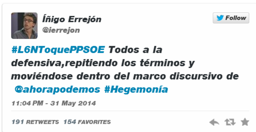
Figura 6: Tuit de Iñigo Errejón sobre la evolución comunicativa en el panorama mediático español tras las elecciones al Parlamento Europeo

La Tesis Doctoral de Errejón, como el mismo resume: es una investigación sobre el proceso político boliviano que se centra en la irrupción del Movimiento Al Socialismo (MAS) como nuevo actor que modifica de forma radical el sistema político y redefine toda la competición política en el país, construyendo una forma de poder político que, como hipótesis principal, se califica de “hegemonía” (Errejón Galván; 2012).