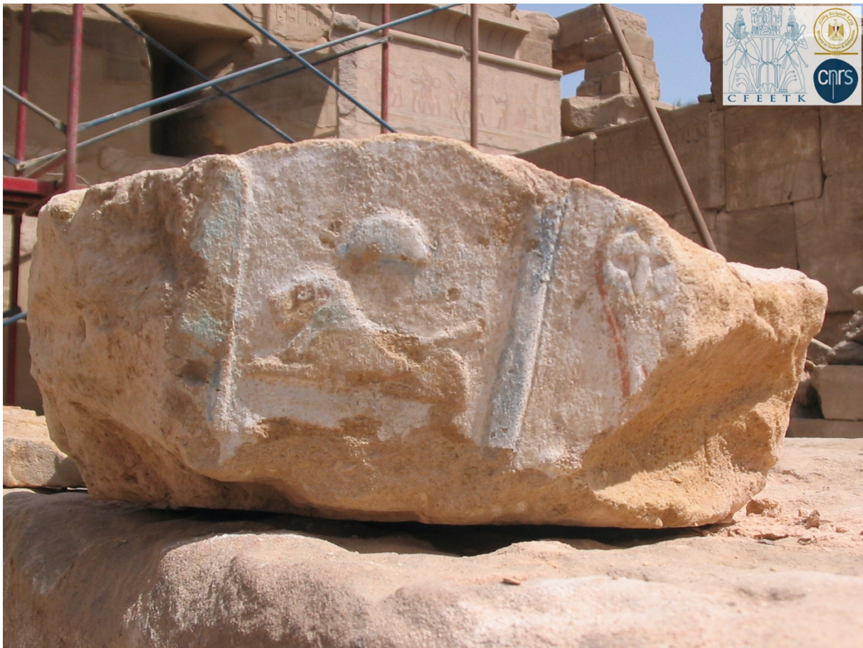
Fig. 1. Fragment des Annales de Thoutmosis III (© CNRS-CFEETK n° 109786/A. Oboussier).

§1. Lors du démontage de la porte de Séthi II, un fragment inscrit portant les restes de quatre signes fut mis au jour 2 . La situation de ce bloc est aujourd'hui inconnue mais on dispose d'une photographie prise au moment de sa découverte (CFEETK n° 109786, ci-dessous) et d'un relevé en dessin sur film plastique réalisé par H. Zacharia (CFEETK n° 106532). Le module du texte polychrome en relief saillant et son orientation correspondent à ceux du reste du texte des Annales de la paroi sud, comme permet de s'en assurer le fac-simile .