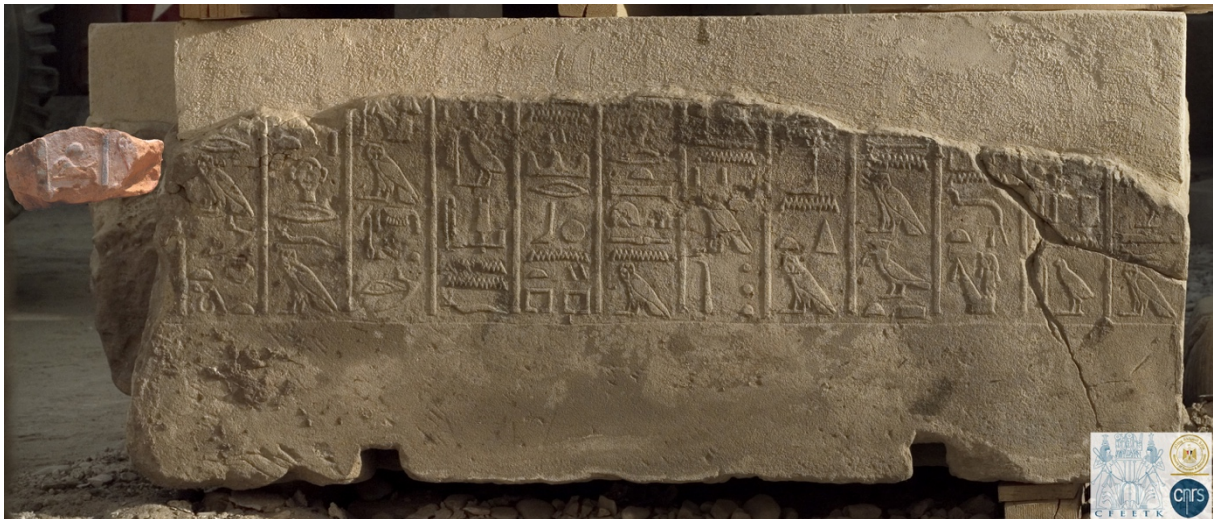
Figure 2. Bloc « J » de la paroi sud des Annales et le fragment.

§4. Comme les restes d'une colonne à droite sont visibles sur notre nouveau fragment, il ne pourrait appartenir qu'à la partie supérieure de la colonne de texte n° 17, celle située au-dessus de la corniche du linteau de la porte. En effet, la partie inférieure de cette colonne est bordée à droite d'une frise à triglyphes longeant le bord du chambranle de la baie et excluant toute possibilité de colonne supplémentaire. Le raccord avec le bloc « J » est satisfaisant en regard de la continuité de la partie supérieure érodée et de l'angle de la cassure quasi verticale qui s'accorde aussi bien avec le fragment qu'avec le bloc. Du reste, il est assuré que le bloc G était à l'origine plus long vers la gauche (est) car il fallait éviter une superposition dangereuse de son extrémité avec les joints droits des blocs J et N, superposition qui aurait engendré un quasi alignement des joints verticaux sur trois assises contiguës.