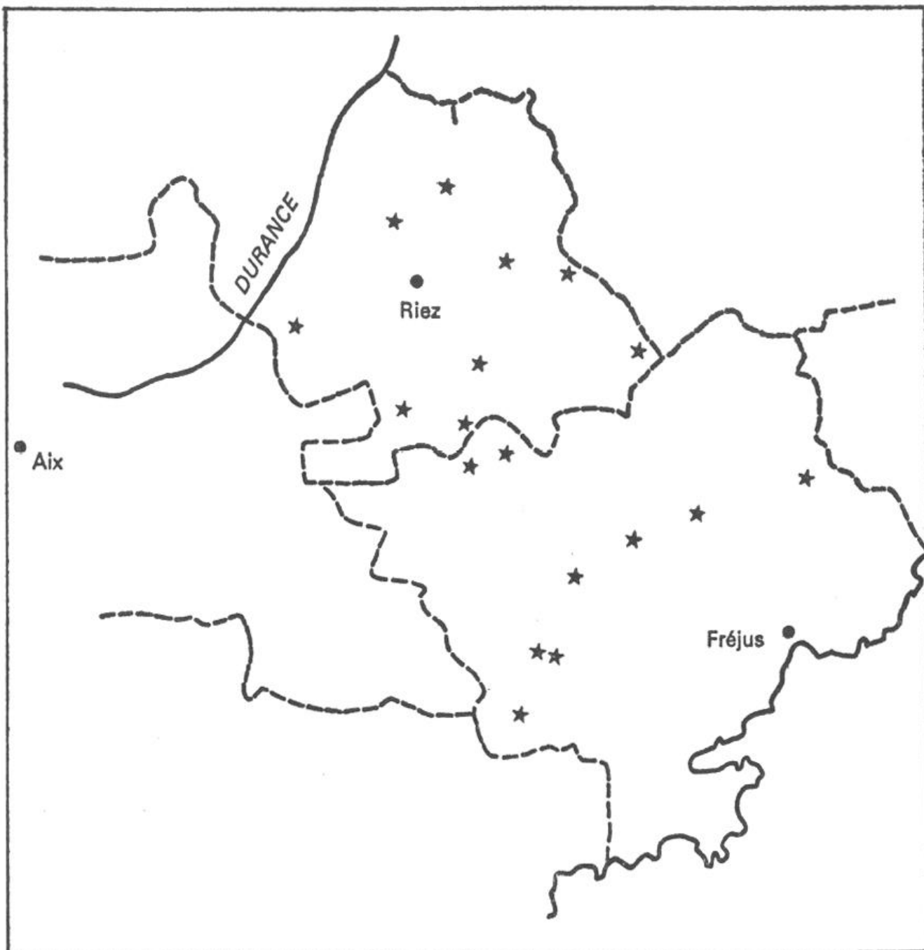
7. Hôpitaux mentionnés par les comptes de décimes des diocèses de Riez (1274) et Fréjus (1352).