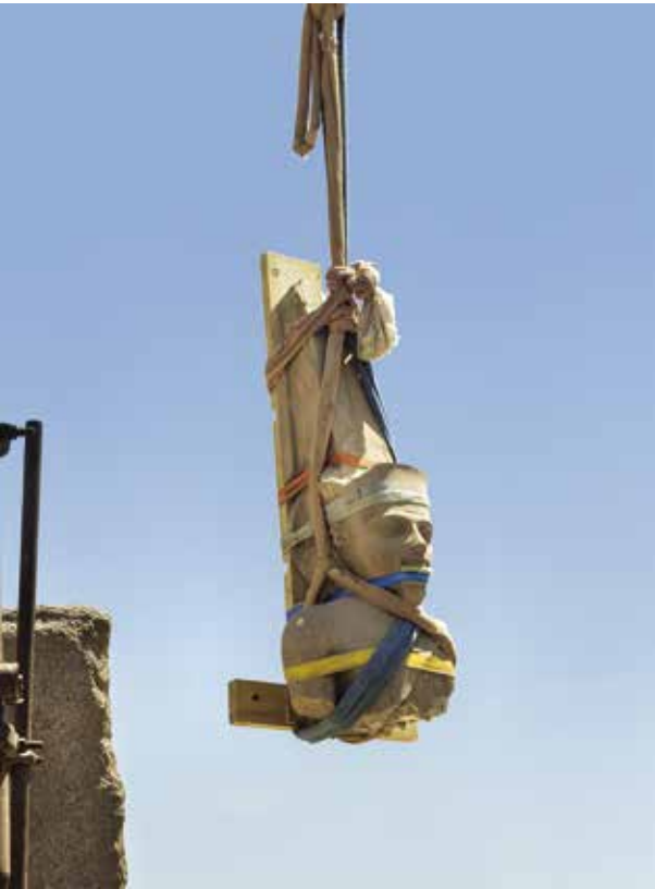
9. Envol du buste d'Amon pour la réparation de la statue. n° 201569 du 16 juin 2019.

Le roi de Haute et Basse Égypte, le maître du Double-Pays, le maître de l'accomplissement des rites Djoserkhépéroure Setepenrê/Nebkheperoure, le fils de Rê, maître des apparitions couronnées, le fils de Rê Horemhebmerenimen/Toutânkhamon, il a fait comme mémorial personnel pour son père Amon-Rê, la réalisation pour lui à neuf d'une statue auguste, étant aimé d'Amon-Rê qui réside dans l' Akamenou dans Karnak; qu'il soit (ainsi) gratifié de vie.