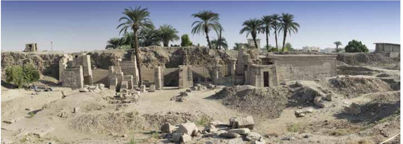
6. Vue du temple de Ptah à Karnak, vers le nord. © CNRS-CFEETK/J.-F. Gout, n° 131011 du 18/11/2009.

à une étude épigraphique et à un programme de restauration ont permis d'établir que l'édifice actuel a été fondé en remplacement d'un monument antérieur occupant le même espace, datant vraisemblablement de la fin de la XVII e dynastie ou du début de la XVIII e dynastie. Les fouilles du temple de Ptah ont aussi permis de mettre au jour en 2014 une favissa contenant 38 objets mobiliers, statues, statuettes et éléments d'appliques statuaires, en calcaire, grauwacke, alliage cuivreux et fritte égyptienne, parfois recouverts d'or.