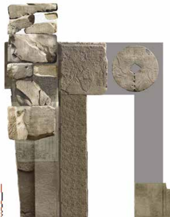
8. Remontage virtuel de la portion des Annales de Thoutmosis III située en arrière-plan de la statue d'Amon (assemblage J. Hourdin).