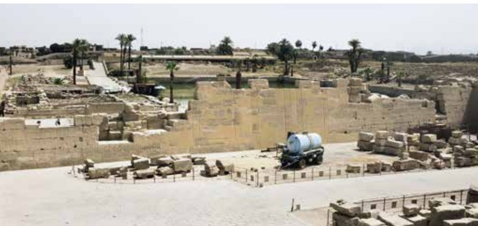
3. Remontage achevé du mur est de la cour de la Cachette. n° 200849 du 21/03/2019.

Forte de cet héritage, la nouvelle équipe permanente du CFEETK, sous la direction de Ramadan Saâd, Jean Lauffray et de Serge Sauneron, débuta son travail sur le site de Karnak en 1967. Le môle ouest du IX e pylône menaçant de s'effondrer, il fut alors décidé de le démonter entièrement avant de le remonter. Cette opération permit la découverte en remploi de milliers de talates provenant des monuments démantelés d'Akhénaton. Ce chantier reste encore à ce jour l'un des plus importants jamais menés par le CFEETK.