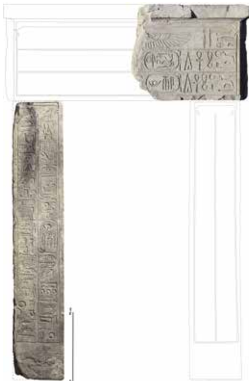
4. Assemblage des fragments de la porte de Sénakhtenrê. © CNRS-CFEETK/J.-F. Gout, n° 136054 du 07/05/2012.