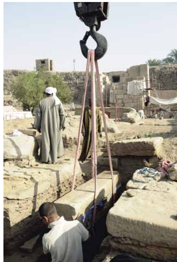
5. Extraction du jambage de la porte de Sénakhtenrê. n° 135671 du 23/02/2012.

Dans son état présent, le temple de Ptah a été fondé par Thoutmosis III (vers 1479-1425 av. J.-C.) et couvre une période chronologique s'étendant jusqu'au règne de Tibère (14-37), avec des phases de construction et/ou de restauration commanditées par Aÿ/Horemheb, Ramsès III, Takélot II (XXII e dynastie), Chabaka (XXV e dynastie), Ptolémée III Évergète I er , Ptolémée IV Philopator, Ptolémée VI Philométor, Ptolémée X Alexandre I er et Ptolémée XII Néos Dionysos. Situé lors de sa construction en dehors de l'enceinte d'Amon-Rê, le temple de Ptah a par la suite été inclus dans l'enceinte de Nectanébo. Les travaux archéologiques conduits sur ce monument par le CFEETK entre 2009 et 2018, associés