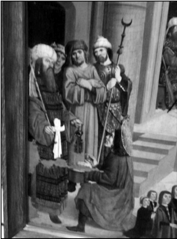
Ill. 1 - Nicolas Froment (1470-1475 ?) Retable de saint Mitre. Détail : le roi remet la clef du clos de vignes à Mitre.

par un clerc qui porte une croix qui semble répondre à la pique surmontée du croissant (ill. 2) 35 . Les hommes et les femmes qui se pressent aux fenêtres pourraient représenter les gens que la sonnerie spontanée des cloches font entrer en extase, comme l'indique le bréviaire.