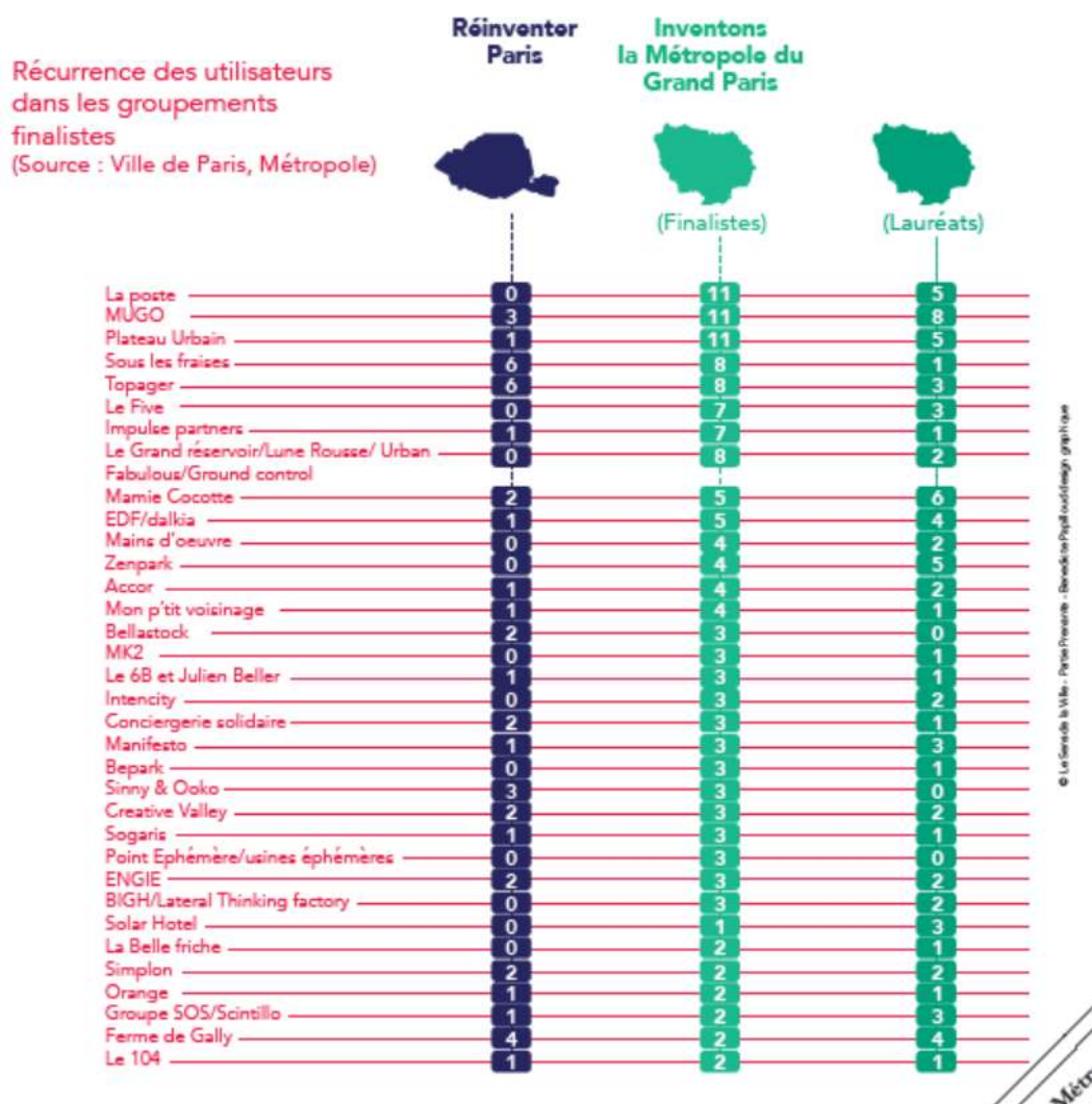
Figure 1- Récurrence des utilisateurs dans les groupements finalistes