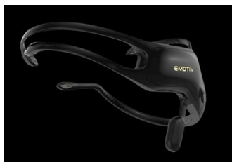
Figure 2. Casque Emotiv INSIGHT

L'acquisition de données d'électro-encéphalographie est faite avec des Casques EEG (Emotiv Epoc+ (Figure 2), et Insight (Figure 3)), en passant par Node-red pour le stockage. L'envoi des données au serveur Node-Red est effectué en partie en s'appuyant sur le protocole OSC, très utilisé en musique.