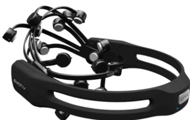
Figure 3. Casque Emotiv EPOC

L'analyse des données des casques peut être effectuée directement dans le cloud Emotiv grâce au système Emotiv pipeline. Mais un nombre croissant d'autres outils éprouvés est mis à disposition par les développeurs dans le domaine du logiciel libre, et par les organismes universitaires. Ces outils de calculs sont souvent moins spécifiques, mais leurs performances sont mieux connues, et leur paramétrage est beaucoup plus accessible dans l'optique de recherches scientifiques.