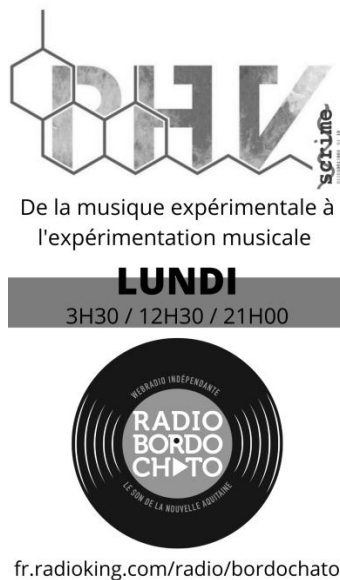
Figure 6. Emission PHV

https://soundcloud.com/radiobordochato/sets/phv