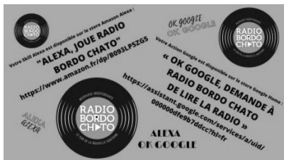
Figure 8. Commandes pour enceintes connectées

L'intégration des différentes actions accessibles par mots-clés se présente sous la forme d'applications comme celles pour smartphone, appelées « Skill Alexa » pour les enceintes Amazon, et « Action Google » pour le matériel Google Home. Une fois l'application téléchargée et installée depuis le « store », on peut lancer la radio en disant simplement à l'enceinte « Alexa, joue Radio Bordo Chato », ou « Ok Google, demande à Radio Bordo Chato de lire la radio » selon le modèle (Figure 8).