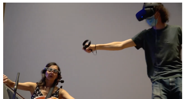
Figure 3. INScore embarqué sur des lunettes EPSON bt-350 (à gauche), dans la pièce "Fantaisie, Querying Schumann's op.73" (J. Bell, 2021)

Cela s'est avéré pratique à des fins de débogage, et a révélé un affichage confortable pour l'utilisateur. La version native Android de INScore a obtenu des résultats stables. L'inconvénient des lunettes EPSON bt-350, pour les tests basés sur un navigateur, est qu'elles ne parviennent pas actuellement à charger les pages html servies par DRAWSOCKET, INScoreWeb ou SmartVox.