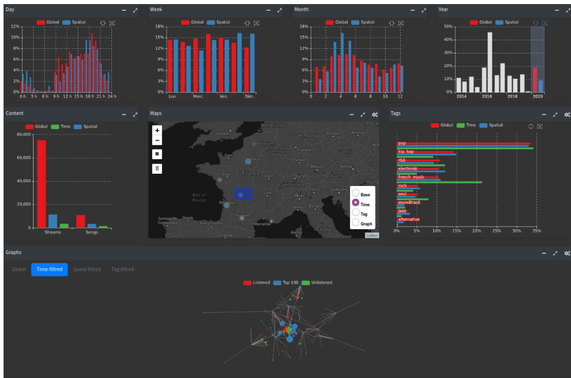
Figure 1. Interface d'exploration interactive des données d'historique d'écoute ("Exploration").