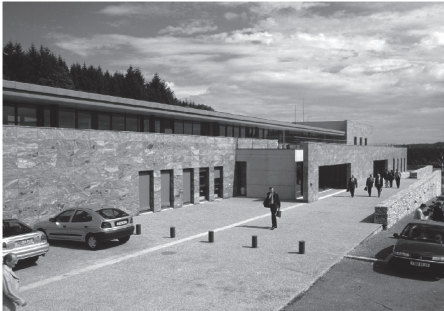
CENTRE ARCHÉOLOGIQUE EUROPÉEN