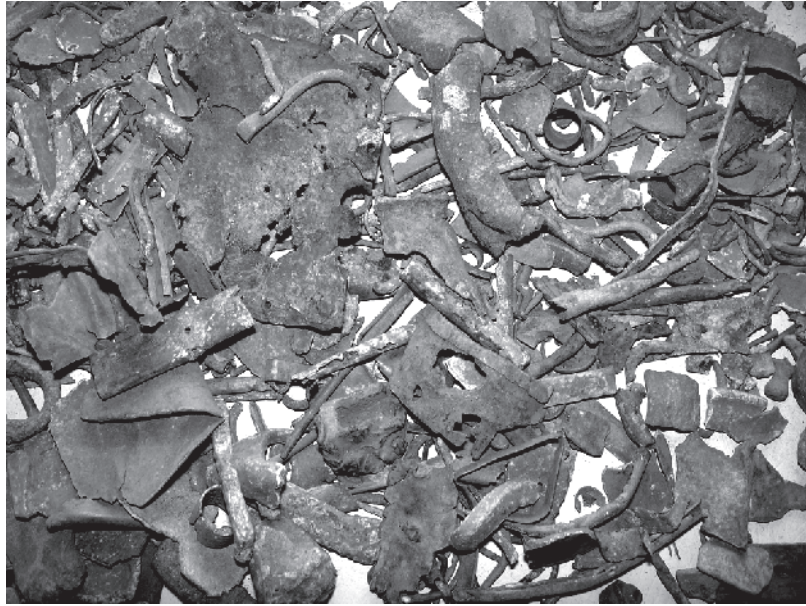
1. Une caisse de mobilier métallique en bronze avant tri.