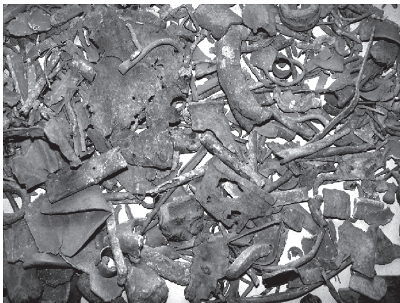
1. Une caisse de mobilier métallique en bronze avant tri.