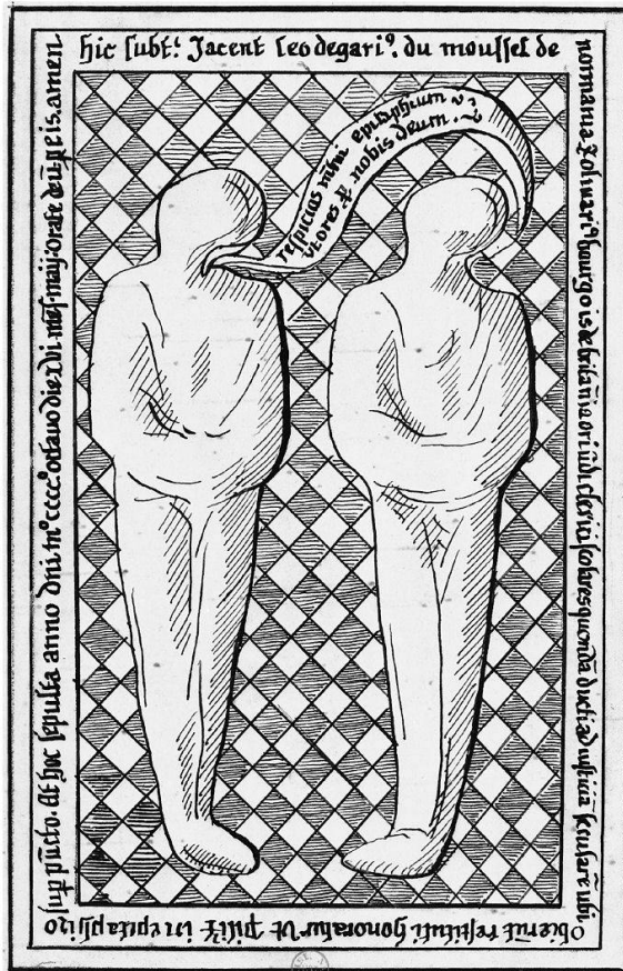
Fig.1: Tombe de Léger du Moussel et Olivier Bourgeois au couvent des Mathurins. Dessin réalisé pour la collection Gagnières. (Bibliothèque Nationale de France, Paris, Est., Rés. Pe 1k, fol. 13.)

premier ensemble, réalisé de façon contemporaine des faits, s'ajoute une seconde inscription en français gravée sur une plaque de cuivre surplombant encore la pierre tombale au XVIII e siècle. Celle-ci reprend les propos de l'inscription latine et ajoute un récit daté et extrêmement détaillé du crime commis par le prévôt, des poursuites de l'Université à son encontre et du rituel de restitution qui lui fut imposé. L'ensemble propose donc un discours remarquablement cohérent sur le crime et sa réparation, tandis que l'image des cadavres enveloppés dans des linceuls semble renvoyer directement au rituel de dépendaison. 38 Contrairement aux sources littéraires relatant cette affaire, ce sont bien les victimes et leur nom qui sont placés au centre de cet ensemble mémoriel d'un fort réalisme, non les criminels. Cette sépulture illustre ainsi le lien cohérent qui pouvait exister entre le crime, la peine rituelle, et la perpétuation de leur mémoire dans des lieux et des monuments précis.