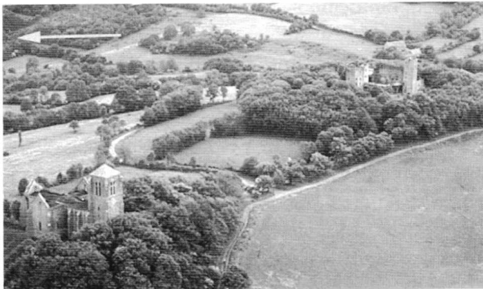
Fig. 1 : Château et collégiale de Thil.

mettre son épée et ses troupes au service du roi de France et s'emploie à pacifier la Bourgogne. Le bouillant capitaine parvient à faire oublier son passé sulfureux. Il intègre même la plus haute aristocratie bourguignonne en épousant une riche veuve : Jeanne de Châteauvillain 7 . Ce mariage lui apporte notamment le château de Thil-