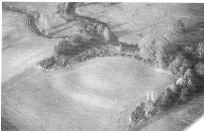
Fig. 3 : Plate-forme de la maison forte de Champfort.

puisque la part de Catherine tomba successivement entre les mains de sa petite fille Jeanne de Villersexel, puis dans celles de la fille de Jeanne, Claude de Bauffremont 31 .