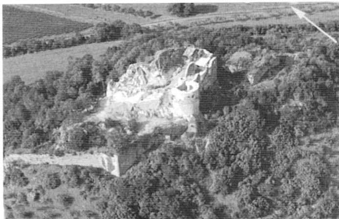
Fig. 2 : Château de Mâlain.

historiens. Ainsi Catherine et Jeanne de Montagu dont les démêlés sont rapportés dans un long intendant de défense à articles 25 . En 1419, Pierre de Montagu, seigneur de Sombornon, meurt au château de Mâlain (fig. 2) 26 . Ses héritiers les plus directs sont ses deux nièces : Catherine, dame de Sombornon, et sa sœur cadette Jeanne, dame de Rougemont. Quand elle