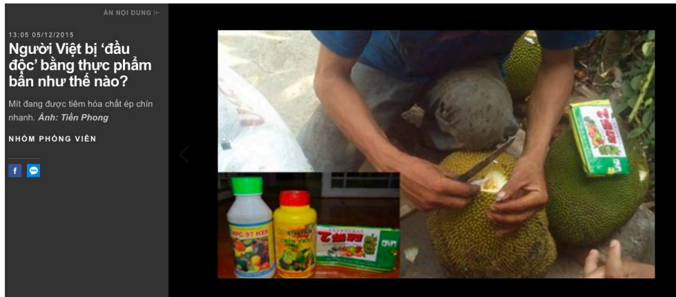
Illustration 2. Page Facebook de Vath Ta Na 28

sur les pesticides. Les articles de presse s'y mêlent à d'autres types d'informations, dont les sources sont plus obscures, qui orientent la perception des dangers liés aux pesticides. Mes interlocuteurs parlaient souvent des vidéos et des images mettant en scène des humains injectant des produits dans les fruits (durian, pastèque) pour les faire grossir ou mieux les conserver 27 .