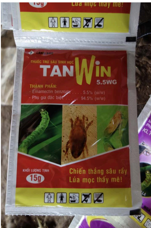
Photos 1 et 2. Insecticides thaïlandais et vietnamiens non enregistrés au Cambodge