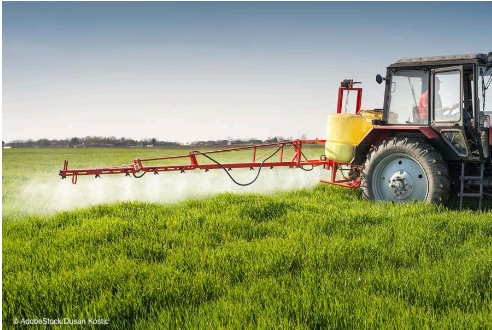
Photos 3 et 4. Équipements préconisés par l'industrie chimique (combinaisons, cabines de protection...)