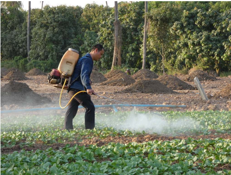
Photos 5, 6 et 7. Les manipulations en pratique au Cambodge