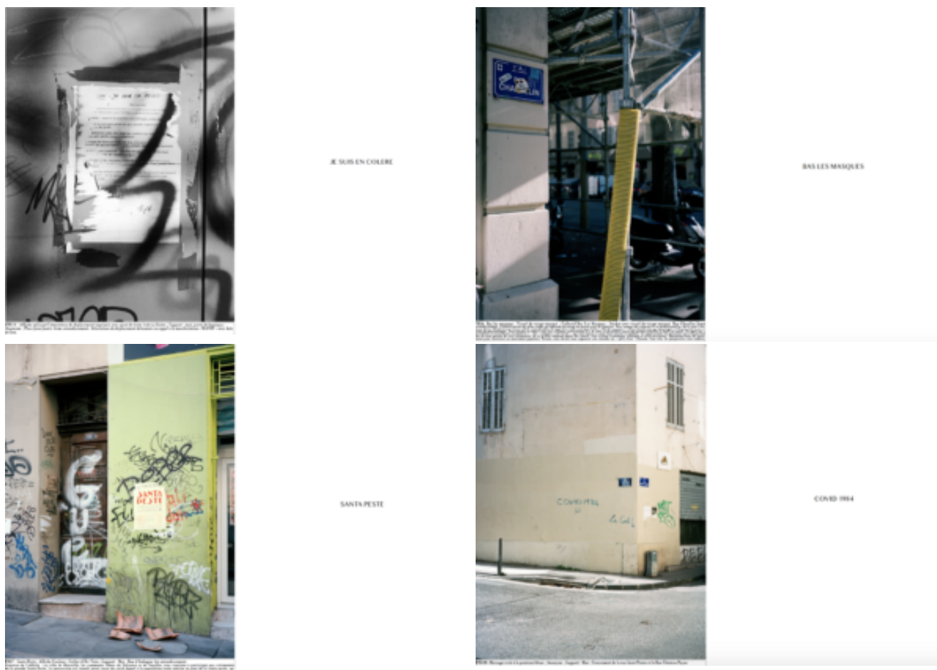
Extrait de « Figures » de Gaëtan Soerensen