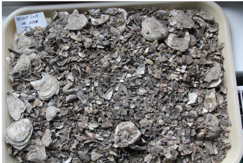
Coquilles issues des refus de tamis de l'US 1197