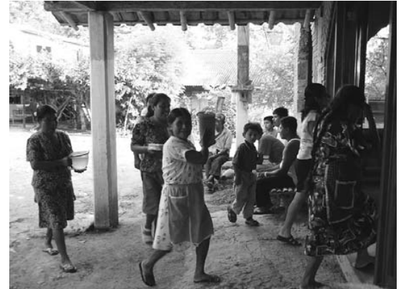
Foto 3. Llegando a un convivio

Los procesos de globalización, de urbanización y de comercialización tienden a separar las esferas de la vida social. Al analizar el desarrollo del capitalismo indus-