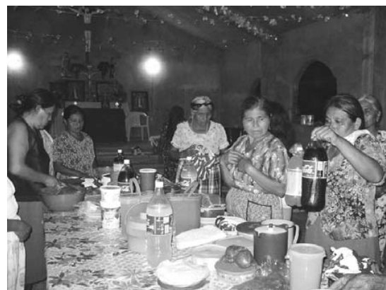
Foto 5. Convivio comunitario en la capilla