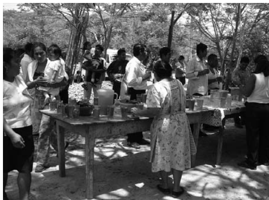
Foto 6. Fiesta en el pueblo