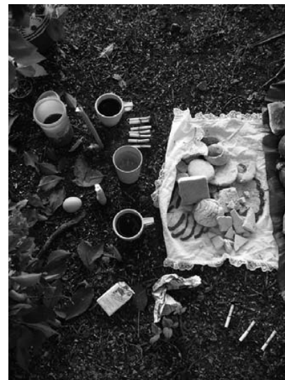
Foto 4. El maxivaso azul sirve para llevar una ofrenda de café a la tierra

En el modo de comercialización de Tupperware más urbano (ventas en reuniones), se percibe la obligación moral de comprarle a un familiar (Biggart, 1989: 186, nota 56). Existe una estrecha relación entre la distancia social y la reciprocidad, reflejada en las sumas de dinero que las invitadas están dispuestas a pagar. Las