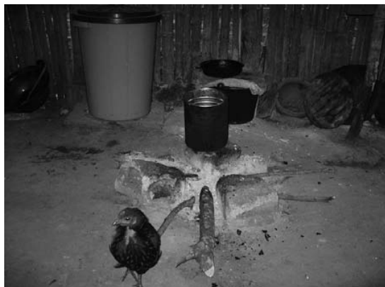
Foto 1. Rincón de una cocina en el rancho

hervida en la cocina, así como encerrar a los animales domésticos, que antes andaban libres por los solares y adentro de las casas y que, al alimentarse con lo que encontraban en el suelo, cumplían la función de recolectar la basura. En efecto, los puercos están hoy en día encerrados en corrales, lo cual implica la tarea doméstica adicional de recoger la basura y quemarla. Pero, como se aprecia en la foto 1, la medida no se aplicó con las gallinas ni con los guajolotes o pavos, que continúan desplazándose por los solares y las cocinas, picoteando restos de comida –como granos de maíz– y, en general, basura orgánica. Según mis interlocutores, estos mordiscos son los que dan el sabor a la carne gallinácea, por lo tanto, no tiene caso encerrar a las aves. A este argumento gastronómico, que justifica no sujetarse a las instrucciones médico-gubernamentales, se añade la concepción cosmológica local en torno a los “pollos de patio”, asociados con la tierra y con los espíritus que viven en ella. Cuando en los ritos de curación se ofrecen tamales a la tierra, siempre se preparan con una gallina de patio y no de granja. En el pueblo coexisten ambas clases de gallina, pero a diferencia de la de patio, la de granja está encerrada en un gallinero, se le da alimento especial de origen comercial; las gallinas de granja sirven únicamente para la comida de los humanos y son criadas con fines de lucro. 1