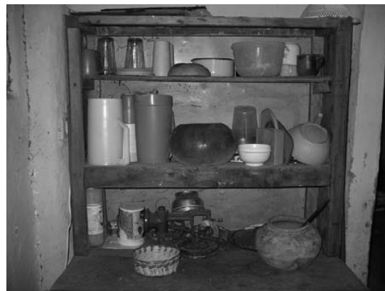
Foto 2. Los tupperware en las cocinas del rancho