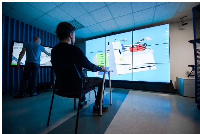
Figure 4. POWER WALL ET TABLE TACTILE 4K