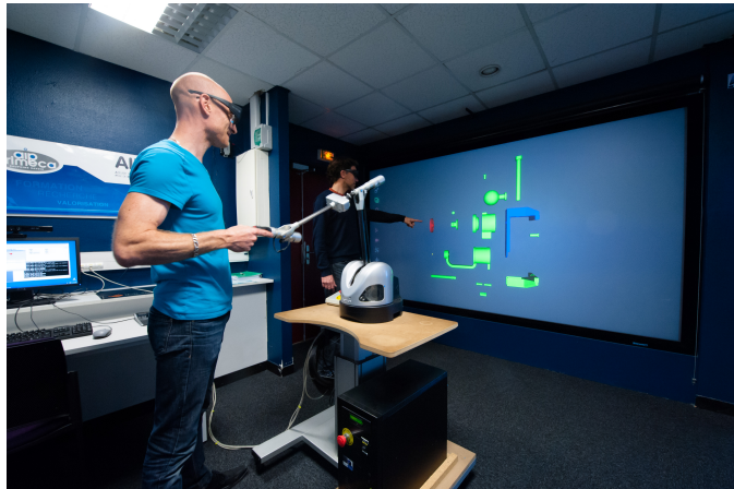
Figure 3. MUR D'IMAGE STEREOSCOPIQUE ET BRAS HAPTIQUE

laboratoire G-SCOP, l'école Grenoble-INP Génie Industriel et le pôle AIP-Primeca Dauphiné Savoie. Le laboratoire G-SCOP a fortement investi dans le développement de cette plateforme technique au travers du projet d'infrastructure européenne VISIONAIR (pilote par G-SCOP) et enfin via différents projets industriels et académiques. D'ailleurs, cet investissement continue avec la labellisation récente par l'ANR de l'EQUIPEX+ CONTINUUM. La plateforme consiste en deux espaces et sera, d'ici quelques mois, étendue à un troisième espace.