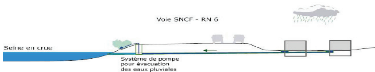
Figure 2 : Schéma de fonctionnement pour l'évacuation des EP lorsque la Seine est en crue (Images Composante Urbaine)

Les dysfonctionnements observés sur le réseau sont nombreux et il en résulte des inondations chroniques. Au-delà des problèmes du réseau, ces inondations sont dues à un ensemble de facteurs, ruissellement des eaux pluviales dû à la topographie, aménagement des infrastructures de transport qui ont ignoré le risque en bouchant les exutoires naturels en construisant le remblai, urbanisation qui a imperméabilisé une part importante des sols, nombreuses résurgences et sources déviées... Ainsi entre 1982 et 2005 Villeneuve Saint Georges a obtenu 18 fois des arrêtés de catastrophes naturelles pour des inondations.