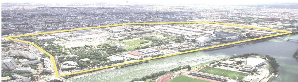
Figure 4 : Vue du périmètre de la ZAC des Docks de Saint-Ouen et de son occupation actuelle

La ZAC des Docks de Saint-Ouen présente un potentiel foncier important à proximité immédiate de Paris. Plus de 100 hectares actuellement occupés par des activités font l'objet d'un projet d'aménagement exemplaire à plusieurs points de vue, notamment ceux de la densité (750 000 m 2 de SHON créés) de la mixité (des formes, des fonctions, des structures et des paysages) et de la gestion des eaux pluviales qui intègre le contexte des sols pollués en place. Les axes stratégiques de l'aménagement proposent un quartier solidaire à l'échelle de la métropole qui serait fondé sur l'histoire, la mixité et la diversité. Ce quartier devra être conçu et vécu de manière participative, il sera en outre à haute valeur écologique. La recherche d'un éco urbanisme se traduit notamment par une intégration dans la ville –espace public et espace privé - du cycle de l'eau, avec une réflexion particulière pour le cas de la gestion des eaux de ruissellement pour partie sur les sols pollués.