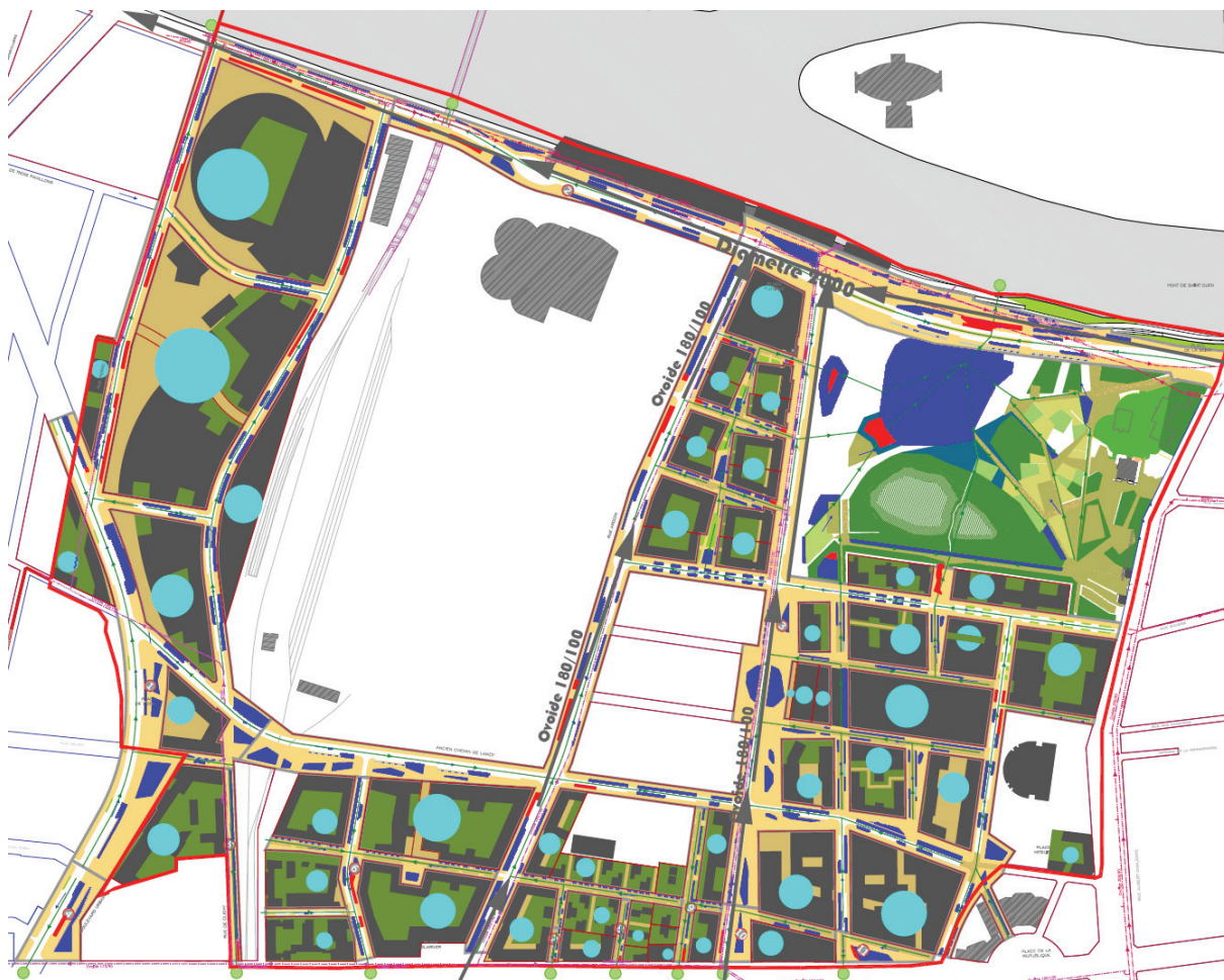
Figure 5 : La trame bleue - en bleu foncé- relative à la gestion des EP dans les espaces publics et la taille des surfaces de stockage dans les îlots - en bleu clair – en gris le réseau d'assainissement existant

Les dispositifs liés à la gestion des eaux pluviales cherchent à se répartir sur l'ensemble de la ZAC dans les espaces publics comme au sein des îlots privés.