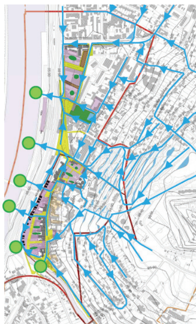
Figure 4 b : Circulation des eaux pluviales après le réaménagement