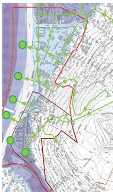
Figure 3 a : Réseau souterrain d'assainissement pluvial et exutoire en Seine

La requalification du centre ville de Villeneuve Saint Georges s'inscrit dans une démarche de développement urbain durable qui s'appréhende ici en termes de dynamique équilibrée, orientée vers la satisfaction des besoins vitaux, d'accès aux services essentiels, de réduction de l'insalubrité et d'augmentation des potentiels urbains.