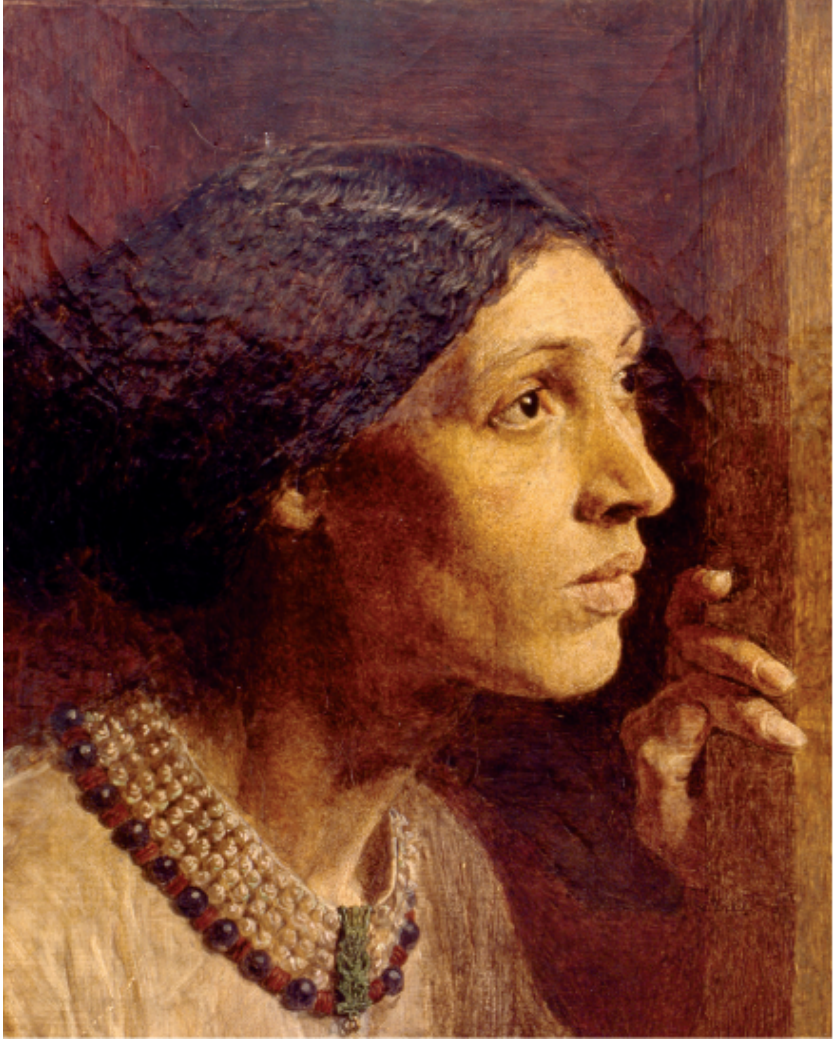
Figure 3. — Albert Joseph MOORE, The Mother of Sisera , 1861. Huile sur toile, 29,4 × 22.5, Tullie House Museum and Art Gallery , Carlisle.