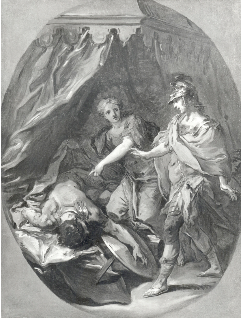
Figure 1. – Carle VAN LOO, Jaël et Sisera c. 1732-1734, huile sur toile, 97 × 73,5 cm. Nancy, Musée des beaux-arts