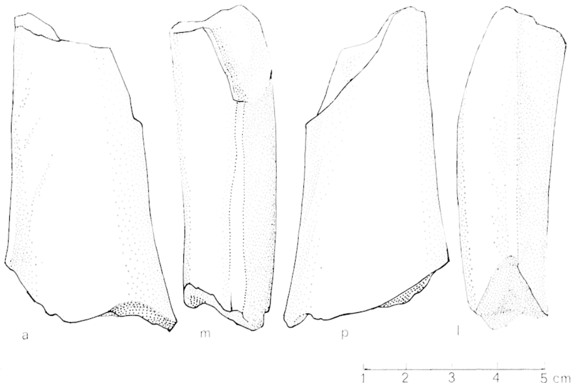
FIG. 1. — MLD 14.

C'est une portion distale diaphysaire d'humérus droit (fig. 1) découvert en 1949. Il fut décrit par Boné (Boné, 1955) comme appartenant probablement à un Australopithèque, ensuite attribué par Wolpoff (Wolpoff, 1973) à un babouin et puis peut-être à un carnivore par d'autres.