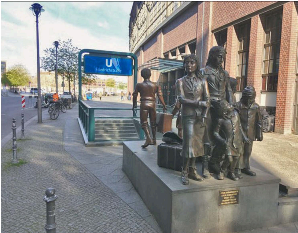
Illustration 3 - Les statues Train to life du sculpteur Frank Meisler

Ces statues rappellent les groupes d'enfants envoyés aux camps d'extermination d'un côté, et les enfants sauvés par leur envoi au Royaume-Uni de l'autre.