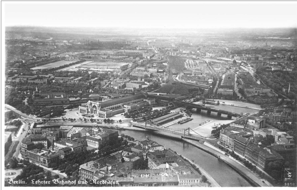
Illustration 1 - Vue aérienne de la gare en 1920

des villes d'Europe qui a connu la plus grande frénésie de reconstructions depuis la chute du Mur et le retour des institutions de l'État allemand.